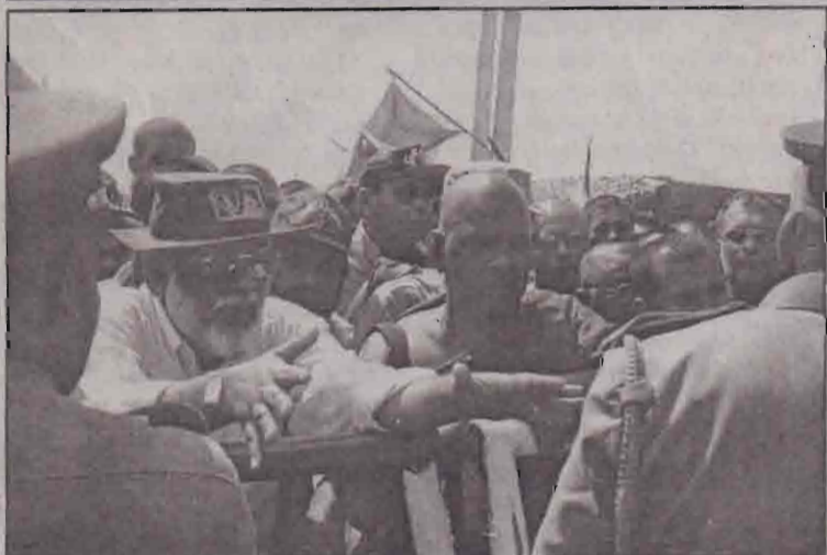
புலிகளின் முகாம் நோக்கிச் சென்ற சிஹல உறுமயவின் மூலக்கா பொல்லாரும் வாக்குவாதப்படும் காட்சி.