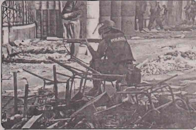
மக்கள் ஆர்ப்பாட்டங்களைக் கலைக்க பொலீஸார் கண்ணீர் புகைக்குண்டு ஏவும் காட்சி.

லாவா, ஓக். 15 பொலிவிய ஜனாதிபதியை பதவி விலக்க கோரி 15 அமைச்சர்கள் இராஜினாமாச் செய்துள்ளனர். இதனால், அங்கு நடைபெற்று வரும் இயற்கை வாயுவை வீழ்த்து எதிரான ஆர்ப்பாட்டங்கள் மேலும் குடுபிடித்திருக்கின்றது. ஆர்ப்பாட்டங்கள் சில இடங்களில் கலவரங்களாகவும் வெடித்திருக்கின்றன. நேற்று நடைபெற்ற கலவரத்தில் கட்டமொன்றினுள் இருந்த 14 பேர் தீ மூட்டிக் கொளுத்தப்பட்டனர். இதில் ஏராளமானோர் எரிசாகித்து இலக்காகினர்.