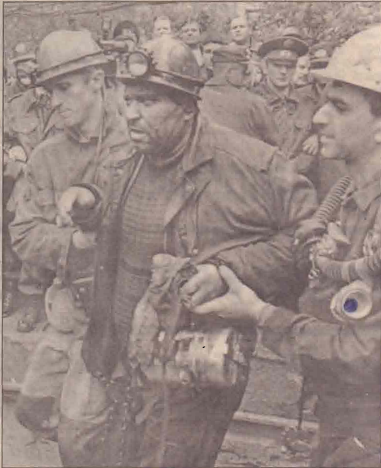
ரஷ்யாவின் தென்பகுதியிலுள்ள கரங்கத்தில் திடீரென வெள்ளம் ஏற்பட்டதால் 46 கரங்கத் தொழிலாளர்கள் அதற்குள் சிக்கிக்கொண்டார்கள். அவர்களை மீட்கும்பணி நேற்று முயலும் கிடம்பெற்றது. கரங்கத் தொழிலாளர் ஒருவர் (மத்த) மீட்புப் பணியாளர்களால் மீட்டுக்கொண்டு வரப்படும் காட்சி

சதாமின் வீழ்ச்சிக்குப் பின்னர் அவரது படைகளின் கட்டுப்பாட்டில் இருந்த பெரும் எண்ணிக்கையான விமான எதிர்ப்பு ஏவுகணைகளுக்கு எண் நடந்து என்பது தெரியவில்லை என்று அமெரிக்கப் படையினர் கூறுகின்றனர். அந்த ஏவுகணைகள் மூலம் அமெரிக்க விமானங்கள் தாக்கப்படக் கூடிய சாத்தியங்கள் இருப்பதாகவும் அவர்கள் தெரிவிக்கின்றனர். (ம)