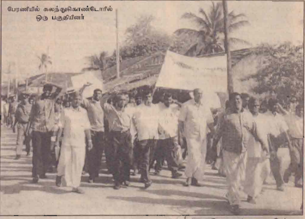
பேரணியில் கலந்துகொண்டோரின் ஒரு பகுதியினர்

"எங்கள் கடல் எங்களுக்கு" "இராணுவமே வெளியேறு", "கடலில் பாஸ் முறை வேண்டாம்" "கடலில் கால் கழுவு அனுமதி பெறுவதா?", "வீடு புழுந்து தாக்கிய இராணுவமே", "கடைகளை நாசமாக்கியது இராணுவமே", "குண்டாந்தடிக்கு அஞ்சமாட்டோம்", "சிறைச்சாலை (16ஆம் பக்கம் பார்க்க)