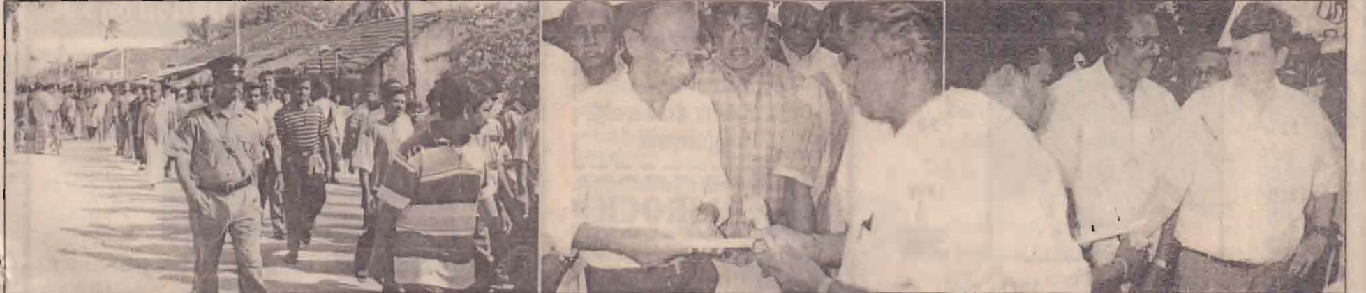
பருத்தித்துறை முனைச் சம்பவத்தைக் கண்டித்து வடமராட்சியில் நேற்று நடைபெற்ற ஆர்ப்பாட்டப் பேரணியில் எடுக்கப்பட்ட படங்கள். பேரணியில் கலந்துகொண்டோரை முதலாவது படத்திலும், பேரணியின் முடிவில் பருத்தித்துறை பிரதேச செயலகமில் வடமராட்சி கழகக் கட்டற்றாழ்வாளர் கூட்டுறவுச் சங்க சமரச செயலாளரும், கண்காணிப்புக் குழுயின் யாழ். அலுவலக பிரதிநிதியும் சர்வதேச தமிழீழ மாணவர் பேரவைத் தலைவரும் மகஜர்களைக் கையாள்பதை அடுத்துள்ள படங்களிலும் காணலாம்.