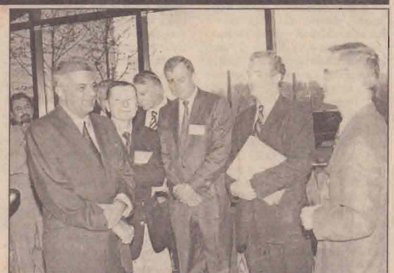
அமெரிக்கா சென்றள்ள பிரதமர் ரணில் விக்கிரமசிங்க மோலாண்ட் உயர்மையல் தொழில்நுட்பப் பூங்காவைப் பார்வையிட்டபோது எடுக்கப்பட்ட படம்.

இந்தப் படிமையத் தக்க தருணமாகப் பயன்படுத்தி பேச்சுக்களை மீண்டும் ஆரம்பிக்குமாறு இருதரப்பையும் அமெரிக்கத் தூதரகம் கேட்டுக்கொள்கிறது. இந்தப் பிணக்குக்கு ஆக்கபூர்வமான அனுசரணை மற்றும் இணக்கம் காண்பதற்கான விருப்பம் ஆகிய வற்றின் மூலம் பேச்சு வழியிலான தீர்வுகளை சாத்தியமே என்று நாங்கள் தொடர்ந்து நம்புகின்றோம். இடைக்கால நிர்வாகம் தொடர்பாக இருதரப்பும் ஒர் இணக்கத்துக்கு (16ஆம் பக்கம் பார்க்க)