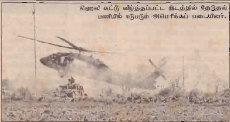
ஹெலி சுட்டு வீழ்த்தப்பட்ட இடத்தில் தேடுதல் பணியில் ஈடுபடும் அமெரிக்கப் படையினர்.