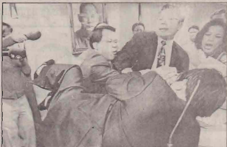
சீனாவில் கம்யூனிஸ்ட் கட்சியின் கூட்டம் ஒன்றில் ஏற்பட்ட கருத்து வேறுபாட்டால் மோதல்கொள்ளும் உறுப்பினர்கள்.

ரூபேஷி, நவ. 7 ஜோர்ஜியத் தலைநகரில் அரசு எதிப்பு ஆர்ப்பாட்டம் குடு பிடித்திருக்கிறது. நேற்று இரண்டாவது நாளை கடந்தே இந்த ஆர்ப்பாட்டத்தில் ஆயிரக்கணக்கானோர் பங்கு பற்றினர். ஜனாதிபதிபதையும், அவரது அரசையும் எதிர்த்து ஆர்ப்பாட்டத்தில் ஈடுபட்டோர் பெரும் சோஷல் மெழப்பினர். இதனால், தலைநகர் ரிப்ளிகியில் பாதுகாப்பு பலப்படுத்தப்பட்டுள்ளது. பொலிசுமும் படைகளும் கல்கடக்குவதற்குத் தயாராக உள்ளனர். அரசு கட்டடங்களுக்கு முன்பாக படையினர் குவிக்கப்பட்டு, அங்கும் பாதுகாப்பு பலப்படுத்தப்பட்டுள்ளது. நாடு வெறிச்சோடியுள்ளதாக அங்குள்ள பி.பி.சி. நிருபர் தெரிவித்தார். நாடாளுமன்றத் தேர்தலில் பெரும் மோசல் நடந்து என்று கூறும் எதிர்க்கட்சிகளே ஆர்ப்பாட்டத்தை நடத்துகின்றன. ஆளும் கட்சி தேர்தலில் மோசல் செய்ததை சர்வதேசக் கண்காணிப்பாளர்களும் உறுதி செய்துள்ளனர். ஆனால், ஜனாதிபதி எவோ ஹொலா நாக இந்த குற்றச்சாட்டை அடிபோட்டு மறுத்துவருகிறார். தேர்தல் முடிவுகள் இன்னமும் வெளியிடப்படவில்லை. தொகுதி முடிவுகள் சில எண்ணூர் பணி முடிந்துள்ளன. அதன்படி, ஆளுங்கட்சியே முன்னணியில் நிற்கிறது. ஆளுங்கட்சிக்கு 25 சதவீத வாக்குகளும், பிரதான எதிர்க்கட்சிக்கு 23 சதவீத வாக்குகளும் கிடைத்துள்ளன. எதிர்க்கட்சிக்கு மேலும் சில கட்சிகள் ஆதரவு தேடுவதற்கும் எண்ணம் உள்ளது. இதனால் ஆளுங்கட்சி ஆளுவதற்கும், எதிர்க்கட்சி ஆளுவதற்கும் இடையே கலவரம் மூளும் என்ற அச்சத்தால் தலைநகரில் பாதுகாப்பு பலப்படுத்தப்பட்டுள்ளது.