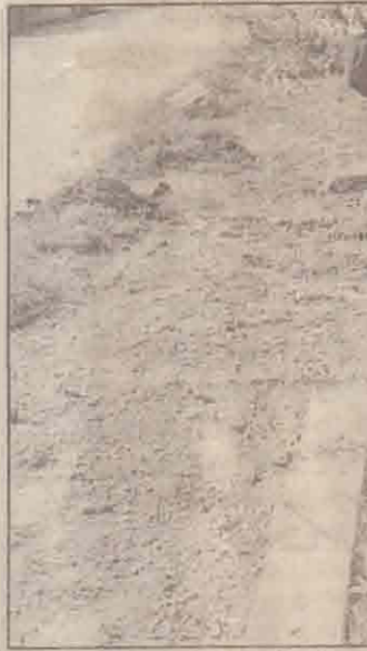
பருவமழை ஆரம்பிப்பதை அடிகாட்டி யாழ். மாநகரசபையின் வீதி ஓரவாய்க்கால்களை முனரமைக்கும் பணிகளை முடிக்கின்றனர். கண்டுக்கடல் பகுதியில் மாநகர கத்தகாப்பு உயிரிய ஓடுவர் இந்தப் பணியில் ஈடுபட்டிருக்க போது....

கொழும்பு, நவ.7 ஜனாதிபதி சந்திரிகா குமாரதாசு இன்று இந்தியாவுக்கு மேற்கொள்ள விருந்த விஜயம் ரத்தானது செய்யப்பட்டது. நாட்டில் உருவாகியிருக்கும் புதிய அரசியல் சூழ்நிலையை இதற்கான காரணமாகவும் என்று அவதானிகள் தெரிவித்தனர். இதற்கிடையே தன்னை உள்ளூர் அமைச்சர் பதவியிலிருந்து நீக்கியதை ஏற்கப் போவதில்லை எனக் கூறி ஜோன் அமரதாசு நேற்றுமுன்தினம் உள்ளூர் அமைச்சுக்குச் சென்று சிறிது நேரம் கடமைகளில் ஈடுபட்டிருந்தார். அமைச்சின் மேலதிக செயலாளர்கள் உட்பட உயர் அதிகாரிகளுடன் அவர் பேச்சு நடத்தினார். (எ)