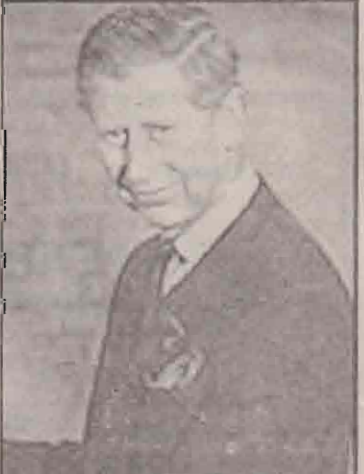
இளவரசர் டயானா மரணித்தபின், கிரேட் வீட்சில் சிறுவன் உட்பட மூவர் ஈராக்கில் உயிரிழப்பு!