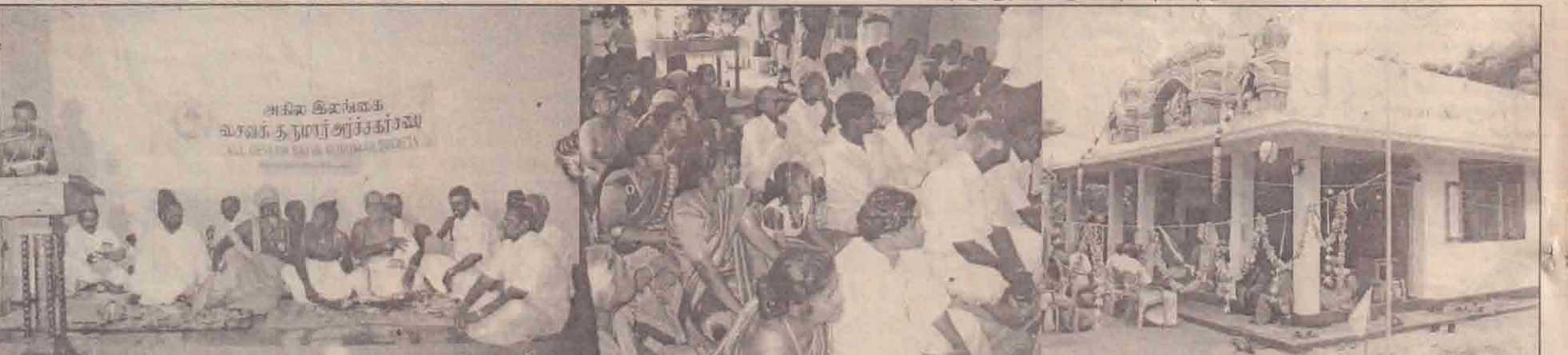
கிரண்டாவது உலக கிழக்கு மாநாட்டு ஞாபகார்த்தமாக கிழக்கு சமய விவகார அலுவல்கள் அமைச்சால் அமைக்கப்பட்ட 'சைவக் குருமார் பயிற்சிக் கல்லூரி' கட்டடத் திறப்புவிழா நேற்று திருநெல்வேலி அம்மன் கோயிலுக்கு அருகில் நடைபெற்றது. விழாவில் கலந்துகொண்ட கிழக்கு மதத் தலைவர்கள் மற்றும் பொதுமக்களையும் திறந்துவைக்கப்பட்ட குருமார் பயிற்சிக் கல்லூரிக்கு முகப்புத் தோற்றத்தையும் படங்களில் காணலாம்.