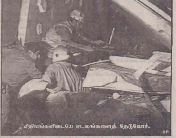
சிதலங்களிடையே சடலங்களைத் தேடுவோர்.

குண்டுகள் நிரப்பப்பட்ட அந்தக் காரை குடியிருப்பு கட்டடத்துடன் மோதியது. இதனால், கார் வெடித்துச் சிதறியது. அடுக்குமாடிக் குடியிருப்பு இடிந்து தரைமட்டமாகியது. தீயும் திடீரெனப் பற்றிக்கொண்டது. இதனால் அங்கு நின்ற காரர்கள் அனைத்தும் தீப் பற்றி வெடித்துச் சிதறின.