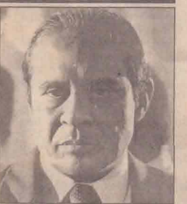
புலிகளின் இந்தக் கோரிக்கைகளை கண்காணிப்புக் குழுவினர் அரசாங்கத்திடம் சமர்ப்பித்தனர். ஆனால், இத்தகைய விடயங்களை கண்காணிப்புக் குழுவினர் அரசுக்கு சிபார்சு செய்தனர் என்று ஜனாதிபதி குற்றஞ்சாட்டுகிறார். இது உண்மைக்கு மாறான ஒரு குற்றச்சாட்டாகும். மேலதிகத்தில் அரசின் மீது சேறு பூச வேண்டும் என்ற திட்டமிட்டு ஜனாதிபதி குற்றஞ்சாட்டுகின்றார். ஜனாதிபதியின் இக்குற்றச்சாட்டுகளை முற்றாக நிராகரிக்கின்றேன். இப்படி அமைச்சர் திலக் மாரப்பன் தெரிவித்தார். (ஐ-9)

சாட்டையும் ஜனாதிபதி முன்வைத்துள்ளார். அதாவது, படையினருக்குத் தேவையான வெடிகளும் குண்டுகளும் ரவைகள் என்பன இல்லை. அவை ஒரு மாதத்திற்குக் கூடபோதுமானவை இல்லை என்கிறார் ஜனாதிபதி. நாம் ஆட்சிப் பொறுப்பை ஏற்ற நாளில் முதல் பத்தம் நடைபெறவில்லை முன்னாள் பாதுகாப்பு அமைச்சரான ஜனாதிபதி பொறுப்பில் இருந்த போது, கையிருப்பில் வைத்திருந்த வெடிகளும் குண்டுகளும் தோட்டாக்களும் அப்படியே இப்போதும் இருக்கின்றன. மேலதிகமாகப் பயிற்சிக்காக மேலதிகமான ஆயுதங்களை நாம் இறக்குமதி செய்துள்ளோம். இந்த உண்மையை ஜனாதிபதி தெரிந்தும் தெரியாதது போல் நடிக்கின்றார். ஜனாதிபதி எம்மோடு நின்று விடவில்லை. கண்காணிப்புக் குழுவினர் மீது குற்றம் கமத்துகின்றார். அதேபோல் பாதுகாப்பு வலயத்தில் உள்ள இராணுவ முகாம்களை அகற்ற வேண்டும். மக்களை அங்கு மீள்குடியேற்ற வேண்டும். தமக்கென தனியான கடற்படை ஒன்றை நிறுவ அனுமதிக்க வேண்டும் என்று புலிகள்தான் கோரிக்கை விடுத்தனர்.