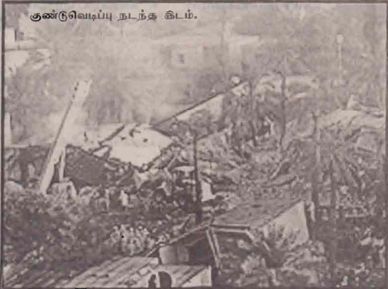
குண்டு வெடிப்பு நடந்த கிடம்.

சவுதி அரேபியாவில் நேற்று சக்திவாய்ந்த குண்டு வெடித்ததில் முப்பது பேர் கொல்லப்பட்டனர். நூற்றுக்கும் மேற்பட்டோர் காயமடைந்தனர். காயமடைந்தவர்களில் பலரின் நிலை கவலைக்கிடமாக உள்ளது என்று வைத்தியசாலை வட்டாரங்கள் கூறியுள்ளன. குண்டு