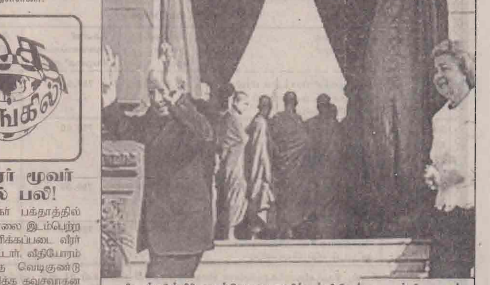
பிரான்ஸின் 90 ஆண்டு கால ஆதக்கத்திலிருந்து சுதந்திரமடைந்த 50ஆவது ஆண்டு தினம் தேற்று கம்போடியாவில் கொண்டாடப்பட்டது. 81 வயதான மன்சன் நொரோடம் சீஹாஜாக் மற்றும் ராணீ மொனியத் ஆகியோர் தலைநகர் பெனோம் பென்மன் உள்ள சுதந்திரசதுக்கத்தில் கிடம்பெற்ற சுதந்திரதன் நிகழ்வுகளில் கலந்துகொண்டனர். கடந்த ஜூலைமீல் கிடம்பெற்ற தேர்தலில் ஏற்பட்ட குழப்ப நிலையை அடுத்து கம்போடியாவின் முன்று பிரதான எதிர்க்கட்சிகளும் கிணைந்து தேசிய அரங்கிணை அமைக்க கடந்த வாரம் கிணைக்கம் கண்டுள்ளன. குறிப்பிடத்தக்கது.

லண்டன் நவ.10 ஈராக்போரின் போது சிறைப் பிடிக்கப்பட்ட அமெரிக்க வீராங்கனை ஜேசிக்கா ஈராக்கியர்கள் வல்லுறவுக்கு உட்படுத்தப்பட்டார் என்று திரைக்கிராம தகவல் தற்போது வெளியாகியுள்ளது. ஈராக்க போரின் போது சிறை பிடிக்கப்பட்ட அமெரிக்க வீராங்கனை ஜேசிக்கா லிஞ்சர், எட்டு நாட்களுக்குப் பின்னர் அமெரிக்க அதிரடிப் படையினரால் மீட்கப்பட்டார். இருபது வயதான ஜேசிக்கா தான் சிறைப் பிடிக்கப்பட்டபோது நேர்ந்த கசப்பான அனுபவங்களை முதன்முறையாக வெளியிட்டிருக்கிறார். எதிரிகளின் பிடியில் இருந்து தப்பிக்க முயன்றபோது காட்டு மிரான் டித்தமனை சில ஈராக்க வீரர்கள் தனது கற்பை குறையாடினர் என்று அவர் கூறி இருக்கிறார். சிறைப்பிடிக்கப்பட்டபோது ஜேசிக்காவுக்கு நேர்ந்த அனுபவங்கள் புத்தக வடிவில் வெளிவர இருக்கின்றன. அதில் இந்த தகவல் வெளியிடப்பட்டிருக்கிறது. இதற்கிடையில், தொலைக்காட்சி ஒன்றுக்கு பேட்டி அளித்த ஜேசிக்கா, தான் விடுவிக்கப்பட்ட போது தவறான தகவல்களை அளித்த தடுக்கலை இராணுவத் தலைமைப்புகளான சென்கன் மீது கண்டனம் தெரிவித்திருக்கிறார். ஈராக்க மருத்துவமனையில் இருந்து பலத்த காயங்களுடன் ஜேசிக்காவை அதிரடிப்படையினர் தாக்கி வருவது போல் அப்போது வெளியிடப்பட்ட வீடியோ படம் தேவையற்ற ஒன்று என்றும், அதிரடிப்படையினர் தமது திறமையை வெளிக்காட்டும் வகையில் பெயர்ப் பிரசாரத்துக்காக தன்னைப் பயன்படுத்திக்கொண்டனர் என்றும் அவர் குற்றம் சுமத்தி இருக்கிறார். இதேபோல், சிறை பிடிக்கப்பட்ட போது இயந்திர துப்பாக்கியால் எதிரிகளை தான் சுட்டதாக வெளிவந்த பெயர்கள் அறிவிப்பையும் ஜேசிக்கா மறுத்திருக்கிறார்.