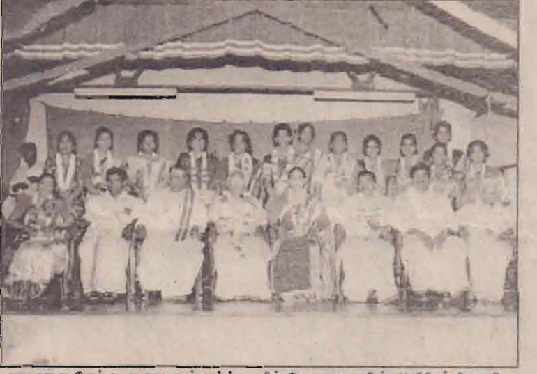
ஏழாலை மேற்கு சைவ சமீபார்க்க வித்தியாலயத்தின் ஆசிரியர்களின் விழாவில் கலந்துகொண்ட அறிவு, ஆசிரியர்கள் மற்றும் விருந்தினர்களைப் படத்தில் காணலாம்.