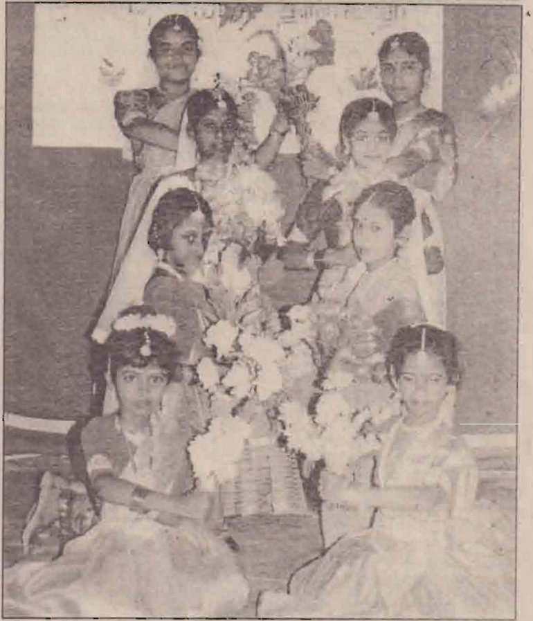
தொல்புரம் விக்கினேஸ்வர வித்தியாலயத்தின் பெற்றோர் தின விழா அண்மையில் நடைபெற்றது. விழாவில் சிறப்பு நிகழ்வாக நடைபெற்ற வரவேற்பு நடவடிக்கை பங்குகொண்ட மாணவர்களைப் படத்தில் காணலாம். (எ)

பாடசாலைகளின் பயன்பாட்டுக் கெடை வழங்கப்படும் கற்றல், கற்பித்தல் தொடர்பான உபகரணங்கள் கூட உரிய முறையில் பயன்படுத்தப்படாமல் களஞ்சிய அறைகளில் போட்டு வைக்கப்பட்டுள்ள நிலைகூட சில பாடசாலைகளில் இன்னமும் காணப்படுவதாக சுட்டிக்காட்டப்படுகிறது. இது சம்பந்தப்பட்ட பாடசாலை அதி