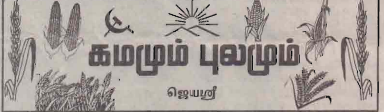
கமமும் புலமும் ஜெயம்தீர்

விவசாயிகளின் வருமானத்தை, விவசாயத்தில் ஈடுபடக்கூடிய மனித வலியை பெறுமானம் குறைவு, உற்பத்திச்செலவு அதிகரிப்பு, போதிய சந்தை வாய்ப்பின்மை, போதிய வாய்ப்பெற முடியாமல் போன்ற பல பிரச்சினைகளை விவசாயிகள் எதிர்நோக்குகின்றனர்.