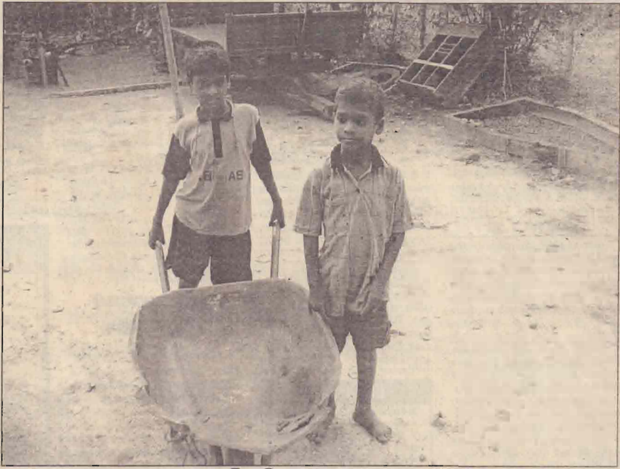
சேச நிர்ப்பாணம்... படல்: பிரேம