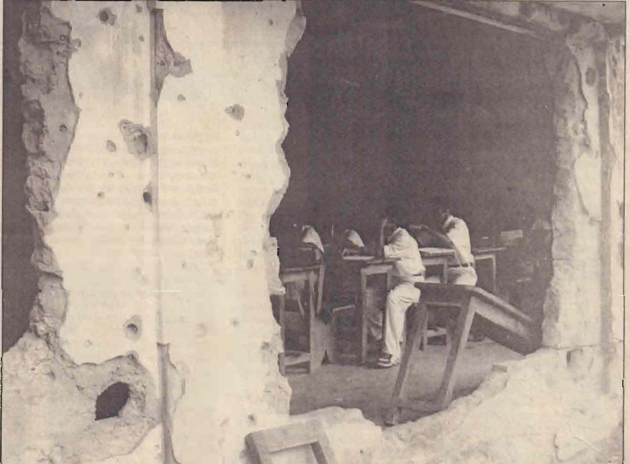
நீட்டிடி விடலிசை அடங்கல... படம்: 8896