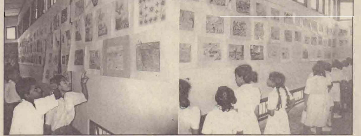
யாழ் கல்வி வலயத்துக்குட்பட்ட பாடசாலை மாணவர்களின் ஒவியக் கண்காட்சி கணகரத்தினம் மத்திய மகா வித்தியாலயத்தில் நடைபெற்று வருகிறது. பாடசாலை மாணவர்கள் கண்காட்சியை பார்வையிடுவதைப் படங்களில் காணலாம்.