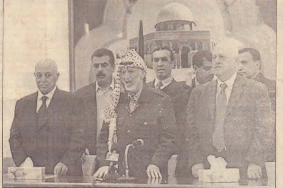
பலஸ்தீன அதிபர் யஸீர் அரபாத் (மத்தி), பிரதமர் அஹமட் குரே (இடது), நாடாளுமன்ற சபாநாயகர் ரபீக் அல்-நட்வா ஆகியோர் புதிய அரசின் நாடாளுமன்ற அமர்வை ஆரம்பித்து வைத்தபோது எடுக்கப்பட்ட படம் இது.

வகுப்பு மரியாதை அளிக்கப்பட்டது. வரவேற்பு முடிந்து பிரதமர் காள் மூலம் விமான நிலையத்தில் இருந்து 15 கி.மீ தூரத்தில் வண்பகுதியில் அமைந்துள்ள நோவோரோவா என்கின்ற இடத்திற்குச் சென்றார். அங்கு பிரதமர் வாஜ்பாயை ரஷ்ய ஜனாதிபதி புட்டின் வரவேற்றார். அதைத் தொடர்ந்து பிரதமர் வாஜ்பாய்க்கு, ரஷ்ய ஜனாதிபதி விளாடிமிர் புட்டின் இரவு விருந்து கொடுத்தார். இச்சந்திப்பின் போது, இரு நாடுகளுக்கும் இடையேயான இராணுவ ஒத்துழைப்பு, சர்வதேச பயங்கரவாதத் துக்கு எதிராகப் போரிடுதல், ஈராக் பிரச்சினை ஆகியவை குறித்து ஆராயப்பட்டன. ரஷ்ய உடயணத்தை முடித்து, அவர் நேற்று கசகஸ்தான் புறப்பட்டுச் சென்றார்.