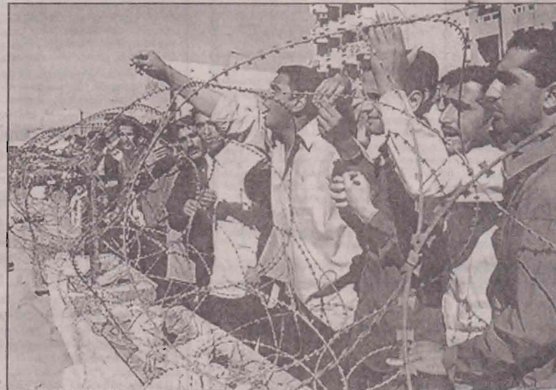
சுரக்கில் பொலீஸர் பவர் தமது சம்பளப்பணத்தை கொடுக்குமாறு கோரி பக்தாத் நகரில் நல்லையம் முன்பாக அர்ப்பாட்டத்தில் ஈடுபடுகின்றனர். சதாம் ஆட்சிக் காலத்தில் அங்கு பொலீஸராகக் கடமையாற்றிய பலருக்கு இப்போது சம்பளம் வழங்கப்படுவதில்லை என்பது குறிப்பிடத்தக்கது.

செய்மதி வழிகாட்டலுடன் இந்த ஏவுகணை விசப்பட்டது. சுமார் 200 கிலோ எடையுள்ள இந்த ஏவுகணை வீழ்ந்து வெடித்த பகுதியில் தீச் சுவாலை மேலெழுந்து வருகின்றது. அங்கு கரும்புகை மூட்டமும் காணப்படுகிறது. இரவு நேரத்தில் நடத்தப்பட்ட இத்தாக்குதலில் ஏற்பட்ட இழப்புகள் குறித்த விவரங்கள் தெரியவில்லை.