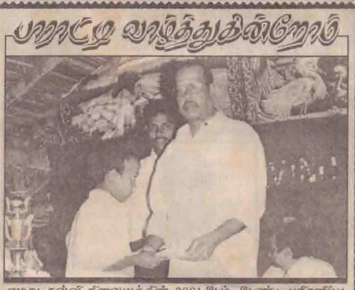
எமது கல்வி நிலையத்தின் 2001ஆம் ஆண்டு பரிசளிப்பு விழாவிற்கு சிறப்பு விருந்தினராக வருகைகாத்து பார்சில் வழங்கிச் சிறப்பித்த