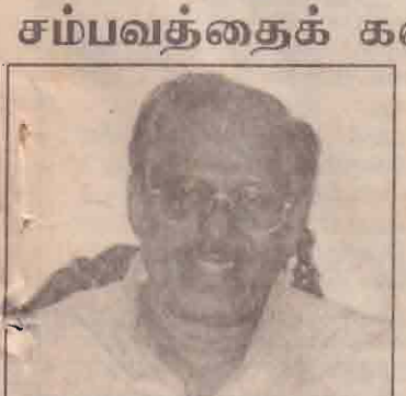
யாழ்ப்பாணம், நவ.18 வலிவடக்கு உயர் பாதுகாப்பு வலயத்தில் அமைந்துள்ள தெல்லிப்பறை ஆதார வைத்தியசாலை, ககா

தார வைத்திய அதிகாரி அலுவலகம் ஆகியவற்றுக்குச் செல்லக் கூடாமைப்பு நாடாளுமன்ற உறுப்பினர் மாவை சேனாதிராஜாவுக்கு பண்டயினர் அனுமதி மறுத்துள்ளனர். இந்த க்காதார நிலையங்களின் தேவைகள் அறிவதற்காக மாவை சேனாதிராஜா தலைமையிலான குழு ஒன்று அங்கு செல்வதற்காக நேற்றுக் காலை 10 மணிக்கு தெல்லிப்பறை சோதனைச்சாவடிக்குச் சென்றுள்ளது.