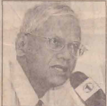
சர் பேராசிரியர் ஜி.எல்.பீரிஸ் கேள்வி எழுப்புகிறார்.

தனது கட்சி அரசு காலத்திலேயே இனப்பிரச்சனைத் தீவு முயற்சிக்கு நேர்வே அரசை அழைத்ததாகக் கூறிக்கொள்ளும் ஜனாதிபதி சந்திரிகா குமாரதுங்க நேர்வே சமாதான அனுசரணையாளர்கள், போர்நிறுத்தக் கண்காணிப்புக் குழுத் தலைவர், கண்காணிப்புக் குழுவினர், நேர்வே தூதுவர் என்று எவரையும் விட்டுவைக்காமல் இன்று குற்றஞ்சாட்டுகிறார். இவ்வாறான நிலையில் நேர்வே தரப்பினர் ஜனாதிபதி மீது நம்பிக்கை வைத்து சமாதானப் பணிகளை மீண்டும் தொடங்குவார்களா? என்று அமைச்சர்