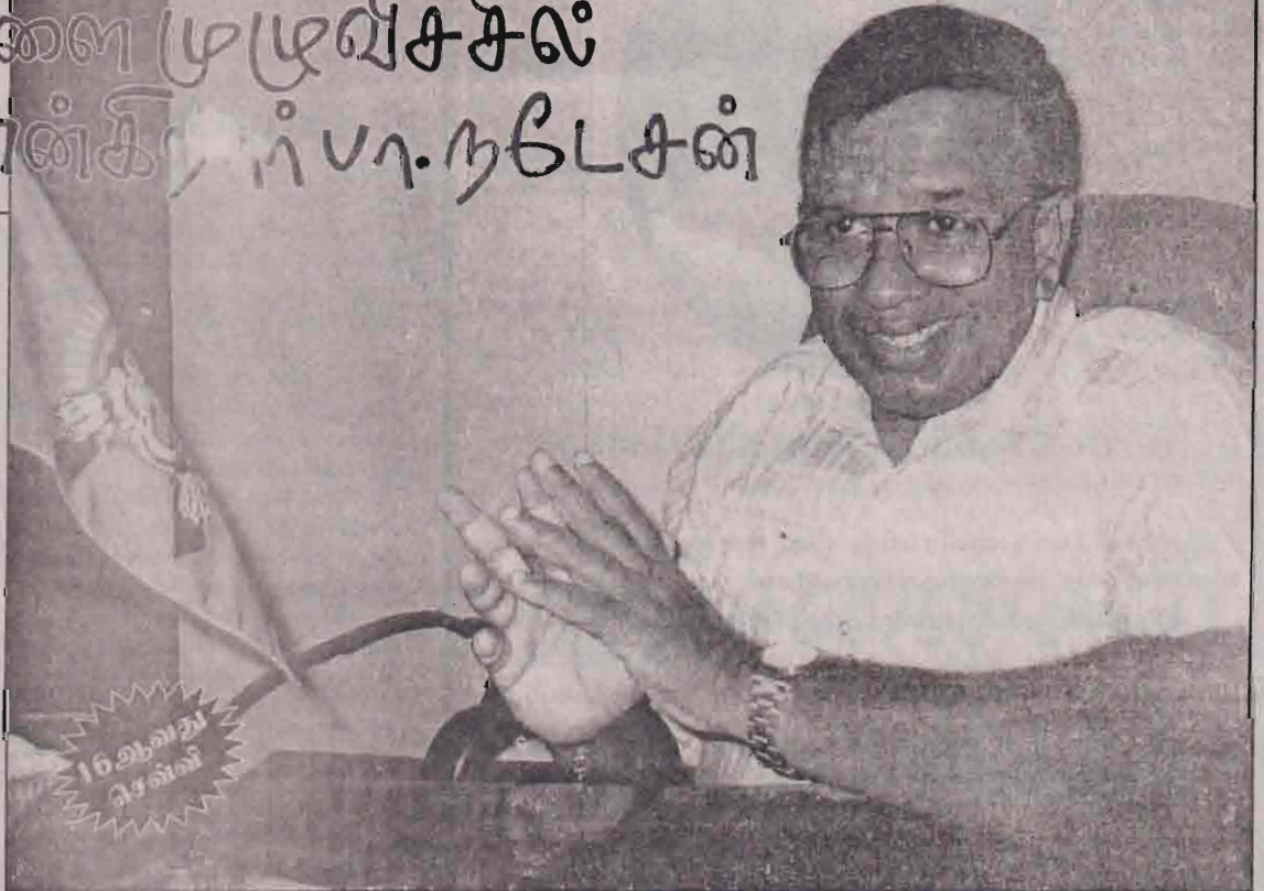
நல்லறிவுகூட்ட வேண்டியது அவசியமாகும். இந்த நிலை அங்கு இல்லை. சமூக சீரழிவுகளை மக்கள் மத்தியில் உருவாக்கும் சக்திகள் இன்னங்காணப்படவேண்டும். இதன் மூலம் எமது பண்பாட்டு விழுமியங்களைப் பாதுகாக்க முடியும். விடுதலைப் போராட்டத்தை பாதிக்கும்

எமது பகுதியில் இடம்பெறும் சம்பவத்தில் சம்பந்தப்பட்டவர் யாழ். ஆஸ்பத்திரியில் மரணமானால் யாழ். நீதி, நிர்வாகத்தின் உதவியை நாம் பெற