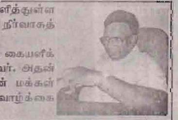
இத்தகைய உத்திகள் குறித்து இவர சந்தி அலுவலகம் இருக்க வேண்டும்.

வடக்கு - கிழக்கு இடைக்கால நிர்வாகம் தொடர்பாக நாம் கையளித்துள்ள வரைவு குறித்துப் பேச்சு சகல அதிகாரங்களும் கொண்டதாக அந்த நிர்வாகத்தைக் கொண்டுவர வேண்டும். அந்த நிர்வாகம் மூலம் சட்டம், ஒழுங்கு பேணும் பொறுப்பு எம்மிடம் கையளிக்கப்படுமாயின் முனைவு முடுக்கெல்லாம் தமிழீழ காவல்துறையினர் பணிபுரிவார். அதன் மூலம் குற்றச் செயல்களுக்கு முற்றுப்புள்ளி வைக்கப்படும். அத்துடன் மக்கள் சகல பிரதேசங்களிலும் சுதந்திரமாக குடியமர்வதன்மூலம் கியல்பு வாழ்க்கை மீளத்தீரும்.