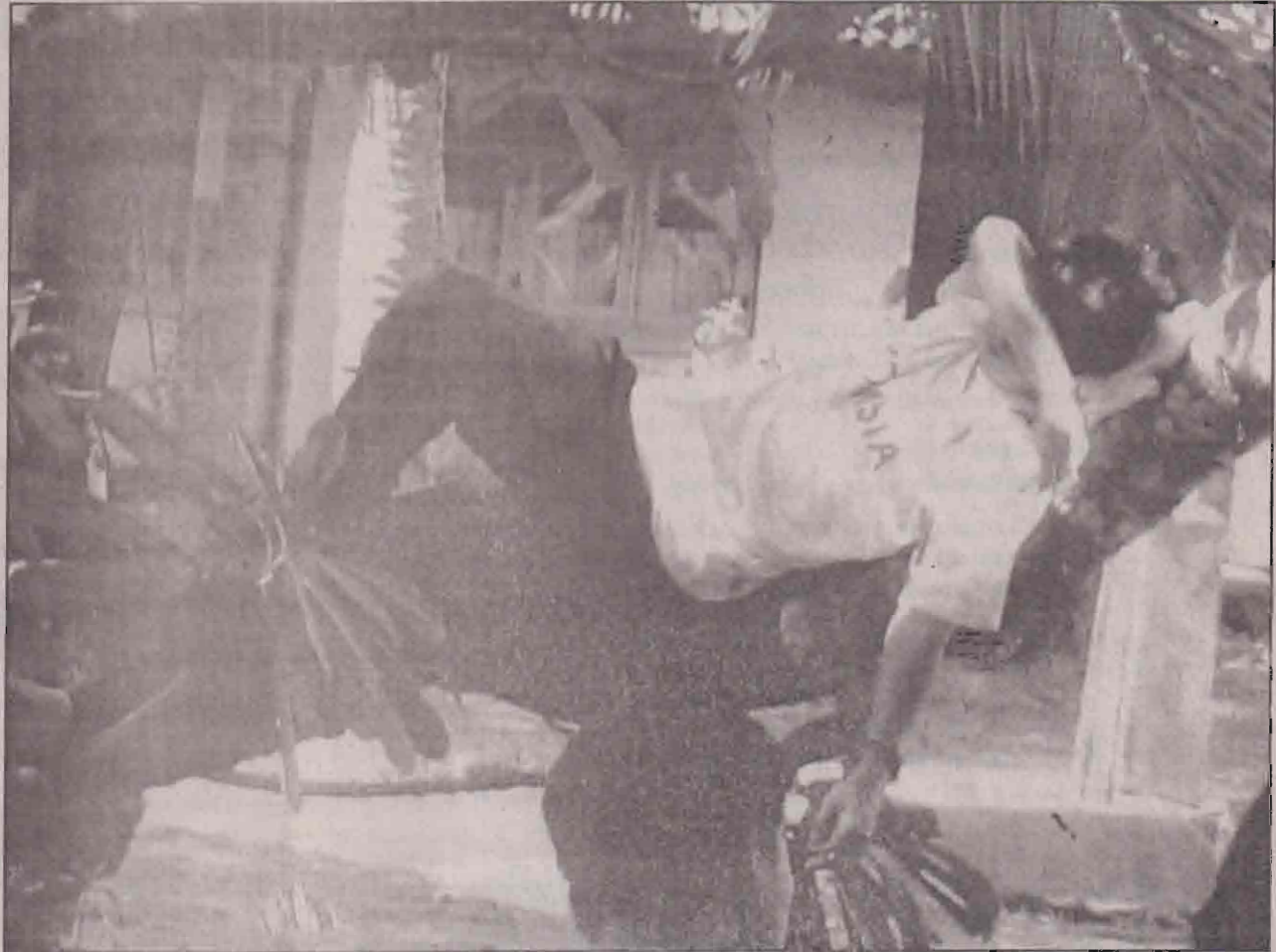
ஒய்யா 2 ஏக்கர்....!