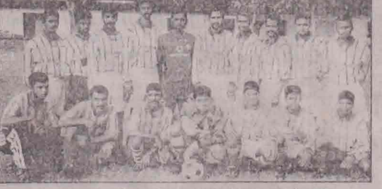
சென் நக்கிலஸ் விளையாட்டுக் கழகம்