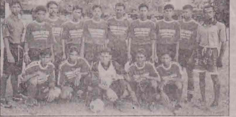
யங்கம்பன்ஸ் விளையாட்டுக் கழகம் - கம்பர்மலை