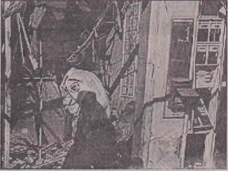
டெல்அவிவில் தற்கொலைத் தாக்குதல் நடந்த இடம்.

இக்குண்டுத் தாக்குதலில் உள்ளூர் பாதுகாப்பு உலகக் காவல்துறை தலைவர் ஒருவர் காயமடைந்தார் என்றும் - அவரை இலக்குவைத்தே இத்தாக்குதல் நடத்தப்பட்டிருக்கலாம் என்றும் - பொலீஸார் மேலும் கூறினர். (ஓ)