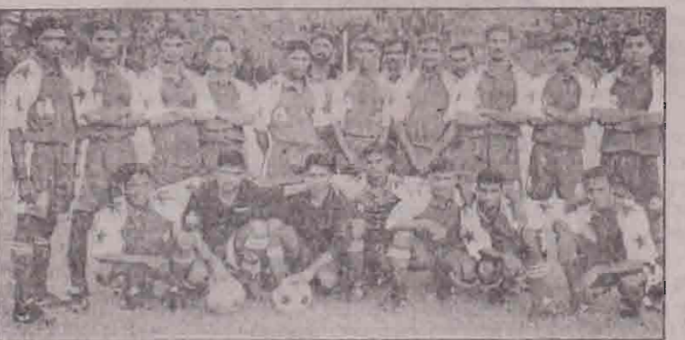
யாழ். சென். மோரிஸ் விளையாட்டுக் கழகம் - நாவாந்துறை