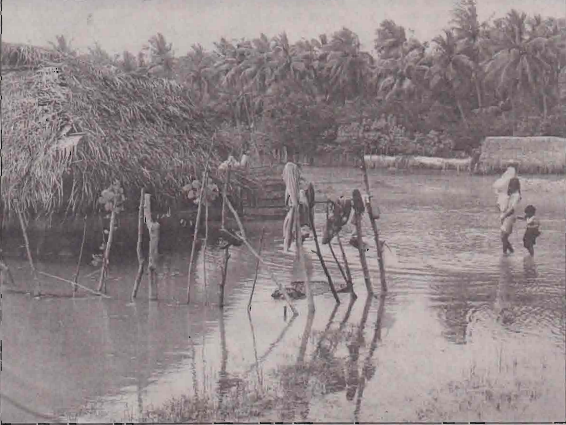
பெரியகங்குலா கோயில் பெய்கள் சேர்?