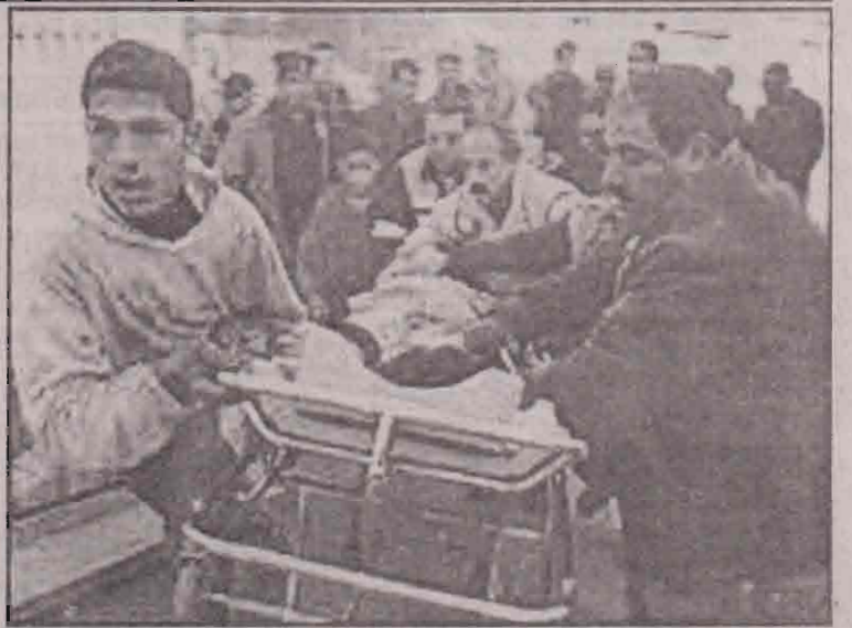
இஸ்ரேலியத் தாக்குதலில் காயமடைந்த பலஸ்தீனர் ஒருவர் மருத்துவமனைக்கு எடுக்கச் செல்லப்படுகிறார்.

கடந்த மார்ச் மாதம் ஜெருசலேமில் நடந்த குண்டுத்தாக்குதலுக்கு தி.க. திட்டிய ஹமாஸ் உறுப்பினர் கொல்லப்பட்டார் என்று இஸ்ரேலியப் படை கூறுகிறது.