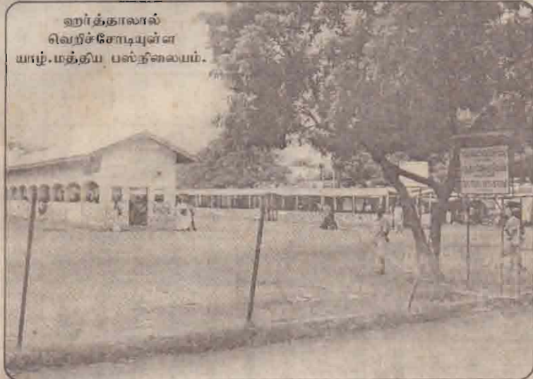
ஹர்த்தாலால் வெறிச்சோடியுள்ள யாழ்.மத்திய பல்கலைக்கழகம்.