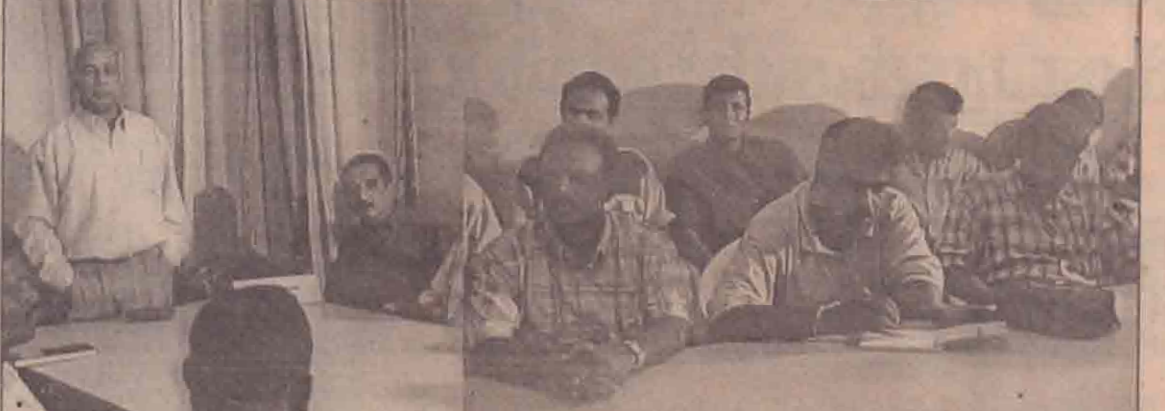
நேற்று யாழ். வந்த கிழக்குப் பத்திரிகையாளர்கள் உதயன் பணியனைக்கு விஜயம் செய்தனர். குடாநாட்டின் தற்போதைய நிலை குறித்து உதயன் ஆசிரியர் பீடத்தினருடன் அவர்கள் கலந்துரையாடினர். அந்தச் சமயத்தில் எடுக்கப்பட்ட படங்கள் இவை.

அந்த செவ்வியல் அவர் தெரிவித்தார். ஒரு சிக்களப் பெண்ணைத் தான் திருமணம் செய்து கொண்டார் என்றும் - 1983 ஆம் ஆண்டு இடம்பெற்ற இனவன்முறையில் தமிழரான காரணத்தால் பொலீஸ் துறையிலேயே தான் பெற்ற அனுபவங்களைப் பற்றியும் அவர் அந்தச் செவ்வியல் நினைவு கூர்ந்தார். இப்போது அவர் உலகுக்கே எடுத்துக்காட்டான ஒரு அமைப்பை முன்னுதாரணமாக வழிநடத்திக்காட்டுகிறார். ஒன்றையாட்சியின் கீழ் இனப்பிரச்சினைக்கு ஒருபோதும் தீர்வு கிட்டப் போவதில்லை. வடக்கு - கிழக்கில் தன்னாட்சி அதிகாரம் வழங்கினால் மாத்திரமே அது சாத்தியம். - இவ்வாறு அவர் தெரிவித்தார். (9)