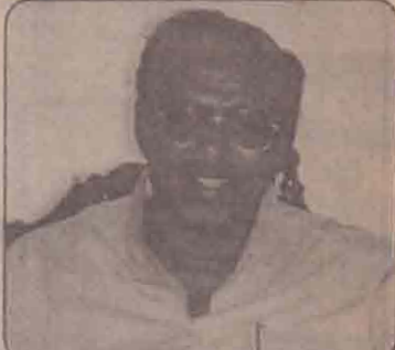
கொழும்பு, டிசெ. 18 பாதுகாப்பு அமைச்சுக்கான நிதி ஒதுக்கீட்டு வாக்கெடுப்பில் ஜே.வி.பி உட்பட அனைத்துக் கட்சிகளும் ஒன்றிணைந்து வாக்களிக்க முடியவில்லையென்றால், நாட்டில் புரையோடிப்போயுள்ள இனப்பிரச்சினைக்கு அனைத்துக் கட்சிகளும் இணைந்து ஏன் தீர்வு காணமுடியாது? தமிழகப்பட்டையடி நாடாளுமன்ற