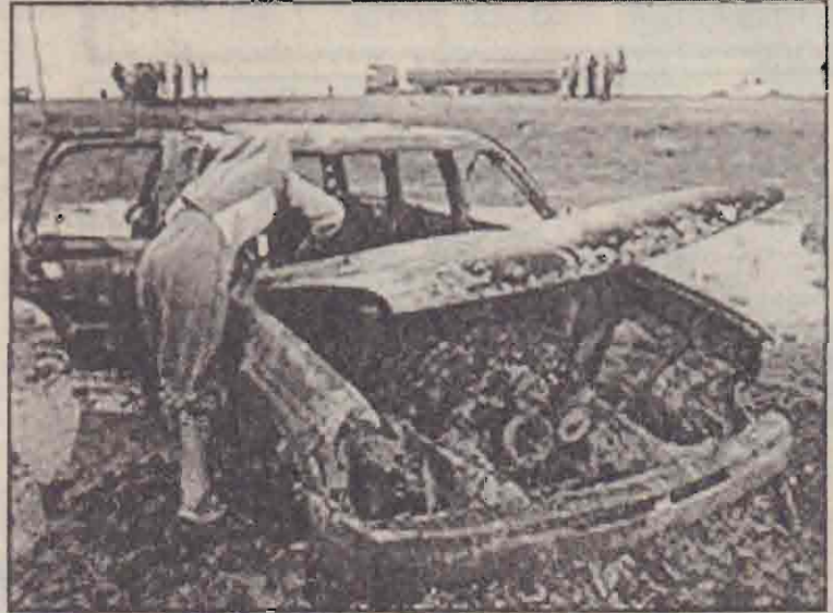
ஈராக்கில் தாக்குதல்களுக்குள்ளான ஸ்பெயின் அதிகாரிகள் பயணம் செய்த காடர் சேதனை செய்யும் பலவாய்ப்பு பயிர்வார்

இதில் அந்த முகாமில் இருந்த இருவர் கொல்லப்பட்டனர். மேலும் ஐவர் காயமடைந்தனர். இதனை ஜப்பானிய அரசு உறுதிசெய்துள்ளது. ஈராக்கில் ஜப்பானிய அதிகாரிகள் கொல்லப்பட்டமை இதுவே முதல்தடவையாகும். இதனால், ஏதாவதும் ஜனணி மாதம் ஈராக்கிற்கு படைகளை அனுப்பத் திட்டமிட்டிருந்த ஜப்பான், இச்சம்பவத்தை அடுத்து படை அனுப்புவது குறித்து மீண்டும் ஆலோசித்து வருகிறது.