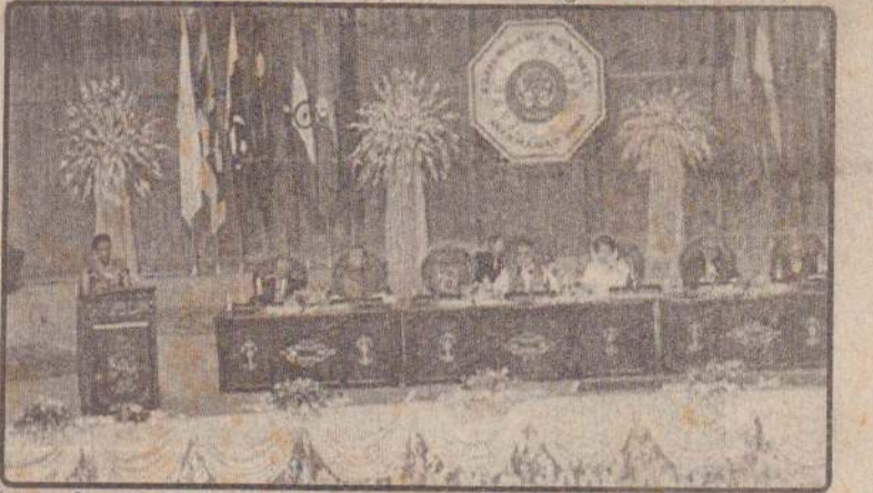
'சாரக்' மாநாட்டில் ஜனாதிபதி சந்திரிகா குமாரதாங்க உரையாற்றுகின்றார்.

கான அழுத்தம் கொடுத்துள்ளார் என்று ஜக்கிய தேசியக் கட்சி வட்டாரங்கள் நேற்றுத் தெரிவித்தன. ஜனாதிபதி தாம் பொறுப்பேற்ற (16 ஆம் பக்கம் பார்க்க)