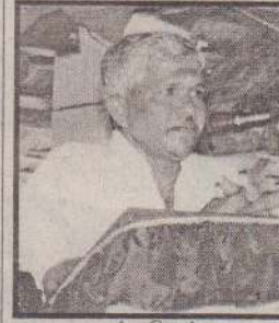
கரணவாய் தெற்கு, கரவெட்டி. (26757) (24-13-16)