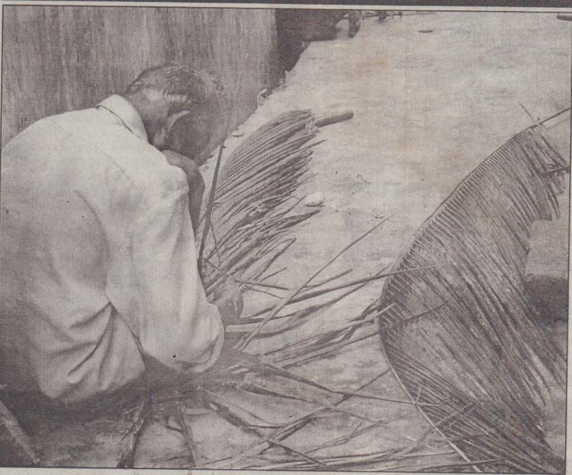
உடல் ஊக்கமும் உயர்ந்த திறமும் உடல் உறுதியும்

11 மாணவருக்கு புலமைப்பரிசில் கொழும்புத்துறை, ஜன.9 அரியாலை அபிவிருத்திச் சங்கம் வருடாந்தம் வழங்கியும் 5 ஆம் ஆண்டுப் புலமைப்பரிசில் உதவி இந்த ஆண்டு 11 மாணவர்களுக்கு வழங்கப்பட்டுள்ளது. அண்மையில் அரியாலை ஸ்ரீ பார்வதி வித்தியாலத்தில் நடைபெற்ற நிகழ்வில் வறுமைக்கோட்டுக்கு உட்பட்ட கற்றலில் ஆர்வமுள்ள 11 மாணவர்களுக்கே இந்த உதவி வழங்கப்பட்டது. (9-30)