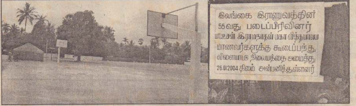
உசன் இராமநாதன் மகாவித்தியாலயத்துக்கு படையினரால் அமைத்து வழங்கப்பட்ட கூடையந்தாட்ட திலையம் அங்கு தரைக்கம் செய்யப்பட்ட பெயர் பலகையையும் படங்களில் காணலாம்.

இளவாலைப் பொலீஸரல்கைது செய்யப்பட்டார். கூடந்த 23ஆம் திகதி இவா மல்லாகம் நீதிமன்றில் ஆஜர் செய்யப்பட்டார். அப்போது கசிப்பு உற்பத்தியிலிருப்பேன் என்று அவர் ஒப்புக்கொண்டார். இதனையடுத்து அவருக்கு 1 லட்சத்து 50 ஆயிரம் ரூபா அபராதம் விதிக்கப்பட்டது. அதனைக் கட்டாதவரின்மால் 18 மாதக் கடுழியச சிறைத்தண்டனையை அனுபவிக்க வேண்டும் என்றும் தீர்ப்பில் கூறப்பட்டது. மேற்படி இளைஞர் சார்பில் அபராதம் செலுத்தப்படவில்லை. இதனால் அவருக்கு சிறைத்தண்டனை வழங்கப்பட்டுள்ளது.