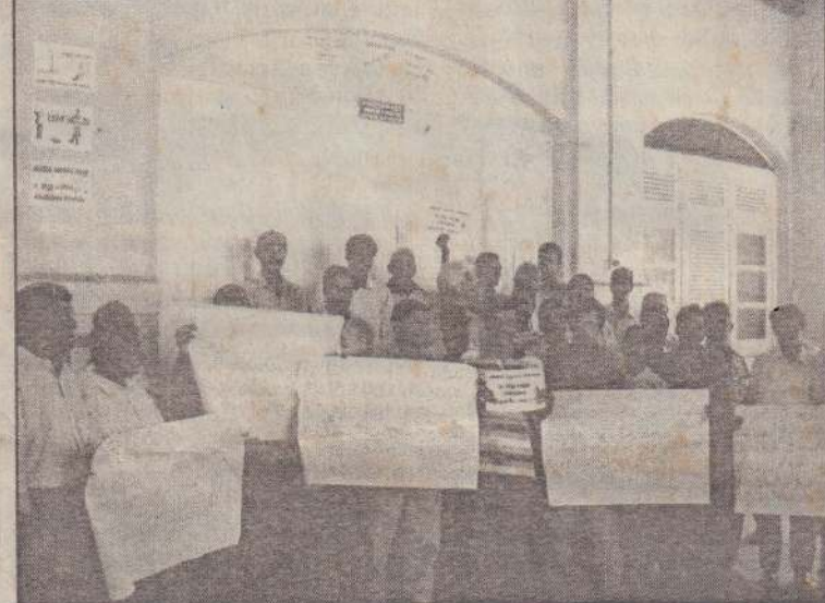
போராட்டத்தில் ஈடுபடும் யாழ். பல்கலைக்கழக ஊழியர்கள்

இலங்கையின் சுதந்திரத்தினத்தை துக்கத்தினமாக அனுஷ்டிக்கக்கோரி விடுக்கப்பட்ட அழைப்பை ஏற்று நாளை யாழ். மாவட்டத்தில் சிற்றூர்திகளின் சேவைகள் இடம்பெறாமலாடாது. இவ்வாறு யாழ். மாவட்டத்தினியார் பஸ் உரிமையாளர்கள் சங்கங்களின் தலைமைச் செயலகம் இவ்வாறு (16ஆம் பக்கம் பார்க்க)