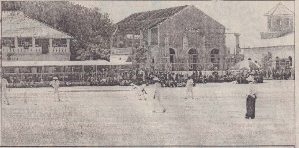
யாழ். மத்திய கல்லூரி மைதானத்தில் நேற்று ஆரம்பமான சென்றல் - சென். ஜோன்ஸ் பெரும் துடுப்பாட்டக் காட்சிகள்.