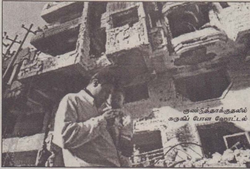
குண்டுத்தாக்குதலில் கருவி போன ஹோட்டல்

இந்தக் குண்டு வெடிப்பின் அதிர்வால் அதற்கு அரை மைல் தூரத்திற்கு அப்பால் இருந்த கட்டடங்களின் ஜன்னல்கள்கூட சிதறியதாகக் கூறப்படுகின்றது.