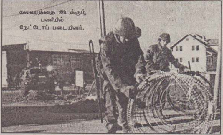
கலவரத்தை அடக்கும் பணியில் நேட்டோப் படையினர்.