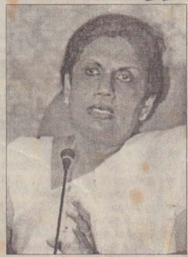
மைப்பான தமிழ்த் தேசியக் கூட்டமைப்புக்கு இவ்வளவு கூடுதலான ஆசனங்கள் கிடைக்கின்றன. இது தமிழ்த் தேசியத்துக்கும், புலிகளே தமிழ் மக்களின் ஏகப்பிரதி (14ஆம் பக்கம் பார்க்க)

கொழும்பு, ஏப்ரல் 4 இதுவரை உத்தியோகபூர்வமாக வெளியிடப்பட்ட தேர்தல் முடிவுகளின்படி ஜனாதிபதி சந்திரிகா குமாரதுங்கவின் சுதந்திரக் கூட்டமைப்பு, பிரதமர் ரணில் விக்கிரமசிங்கவின் ஐக்கிய தேசிய முன்னணியை விடப் பல லட்சம் வாக்குகளைக் கூடுதலாகப் பெற்று முன்னணியில் நிற்கிறது. எனினும் அந்தக் கூட்டமைப்பால் தனித்தோ அல்லது வேறு கட்சிகளின் எம்.பிக்களுடைய ஆதரவுடனோ ஆட்சி அமைக்க முடியுமா என்பது கேள்விக்குறியாகவே இருக்கிறது.