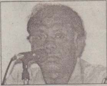
சுற்றினார். முன்னாள் அமைச்சர் மேலும் தெரிவித்ததாவது:- ஆட்சி அமைக்கவுள்ள கூட்டமைப்பில் ஜே.வி.பி.யும் அங்கத்தவம் பெறு