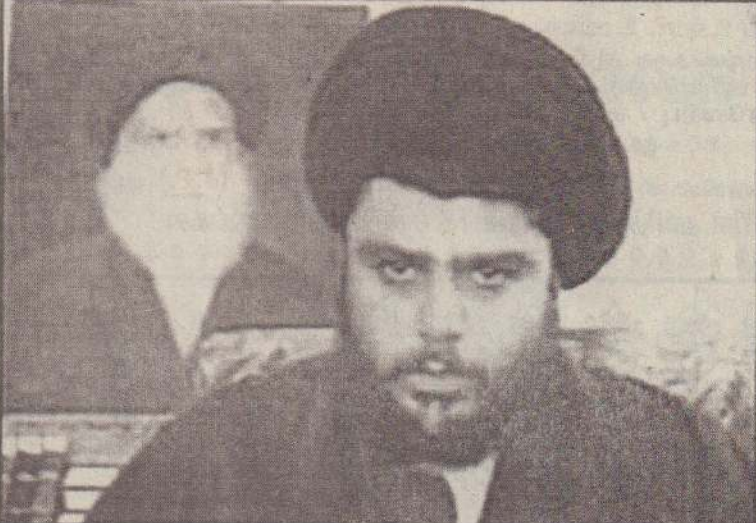
ஈராக்கில் தொடரும் ஆர்ப்பாட்டங்களின் போது அடிக்கடி கிடம்பெறும் மோதல்களில் உயிரிழந்த தமது சகா ஒருவருக்கு அஞ்சல் செலுத்தும் அமெரிக்கப் படையினரைப் படத்தில் காணலாம். அருகே தற்போதைய ஆர்ப்பாட்டங்களுக்குக் காரணமானவர் எனக் கருதப்படும் ஷியா முஸ்லிம்களின் தலைவர் மொக்டாடா சடரின் படம்.