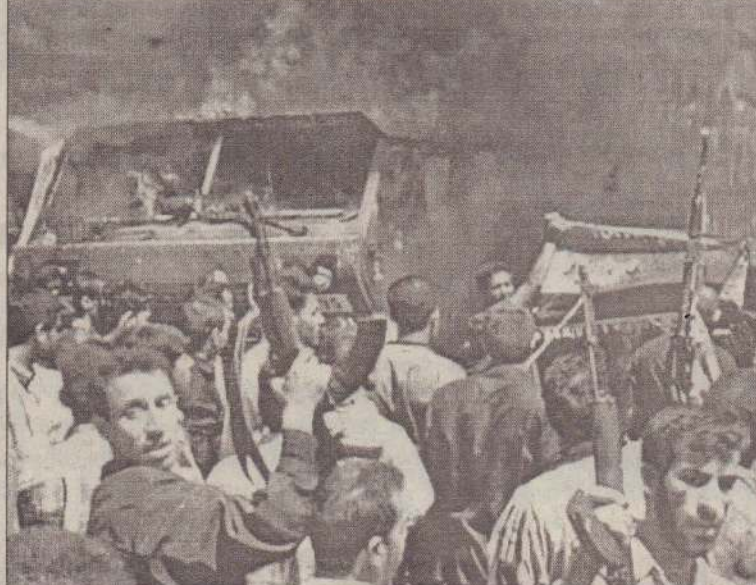
ஆக்கிரமிப்புப் படைகளுக்கு எதிராக ஷியா முஸ்லிம்கள் ஈராக்கில் தொடர்ந்து நடத்திவரும் ஆர்ப்பாட்டங்களின்போது எரிக்கப்பட்ட அமெரிக்க குருப்புக்காவல் வாகனத்தின் அருகே ஆர்ப்பாட்டக்காரர்கள் கோஷம் எழுப்பியபடி குதூகலிப்பதையும் காயமடைந்த ஆர்ப்பாட்டக்காரர் ஒருவர் மருத்துவமனைக்கு எடுத்துச் செல்லப்படுவதையும் படங்களில் காணலாம்.

கள் தெரியவரவில்லை. இதற்கிடையில் - நஜாப் குழுப்பங்களை அடுத்து எதிர்ப்புப் பேராட்டங்களைக் கைவிட்டு தனது அலுவலகத்தில் அஸ்து பள்ளி வாசல்களில் வந்துகூடுமாறு ஷியா முஸ்லிம்களை மதத்தலைவரான மொக்டாடா சடர் கோரியிருக்கிறார் என அவரின் உதவியாளர் ஒருவர் தெரிவித்தார். "உங்கள் எதிரிகளை அச்சப்படுத்தாதீர்கள்; அவர்களின் வன்முறைகள் தொடர்பாக அமைதி காத்திருக்க முடியாது" - இப்படி அவர் அறிக்கை ஒன்றில் தெரிவித்திருக்கிறார் எனவும் கூறப்பட்டது. எனினும், கூட்டுப்படைகளுக்கு எதிராக வன்முறைகளை ஆரம்பிக்கக் கோரும் அழைப்புத்தான் இதுவா என்பதை உறுதிப்படுத்தமுடியவில்லை. இதேசமயம் - அமெரிக்கா தலைமையிலான கூட்டுப்படைகளுக்கு எதிராக அடிக்கடி தாக்குதல்கள் இடம்பெற்றுவரும் அல்-அன்பர் மாகாணத்தில் நேற்றுமுன்தினம் இடம்பெற்ற மற்றொரு சம்பவத்தில் இரு அமெரிக்கப் படையினர் மரணமாகினர். (க)