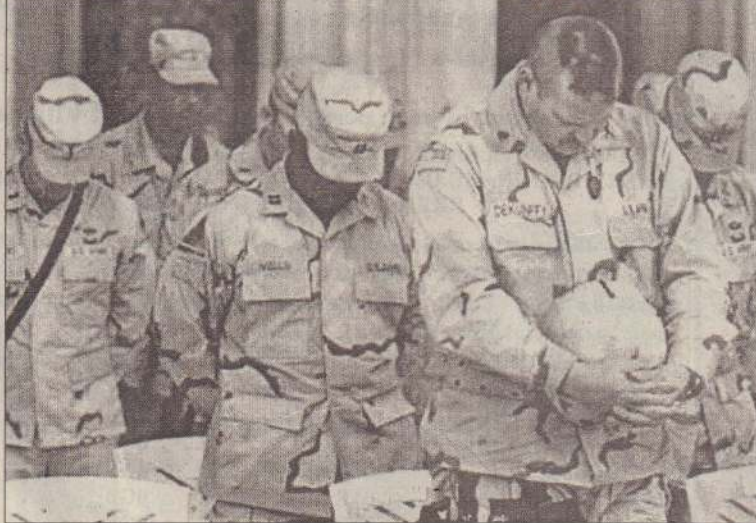
ஈராக்கில் தொடரும் ஆர்ப்பாட்டங்களின் போது அடிக்கடி கிடம்பெறும் மோதல்களில் உயிரிழந்த தமது சகா ஒருவருக்கு அஞ்சல் செலுத்தும் அமெரிக்கப் படையினரைப் படத்தில் காணலாம். அருகே தற்போதைய ஆர்ப்பாட்டங்களுக்குக் காரணமானவர் எனக் கருதப்படும் ஷியா முஸ்லிம்களின் தலைவர் மொக்டாடா சடரின் படம்.