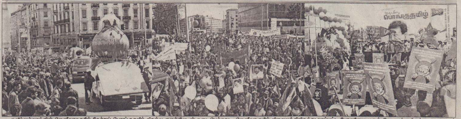
சுவிஸ்லாந்தின் ஜெனீவாநகரில் நேற்றுப் பொங்குதமிழ் நகழ்வு எழுச்சியுடன் நடைபெற்றது. ஜெனீவா ரயில் நிலையத்திலிருந்து புறப்பட்ட பேரணியை முதல் கிடுபடங்களிலும் ஐ.நா.சபைக் கூட்டத்தின் முன்பாக கிடம்பெற்ற நகழ்வில் பொங்குதமிழ் பிரகடனம் பிரகடனப்படுத்தப்படுவதைக் கடைசிப் படத்திலும் காணலாம்.

சுடர் 19 வள்ளுவர் ஆண்டு 2035 பங்குனி 24 செவ்வாய்க்கிழமை (06-04-2004) UTHAYAN - A Lively National Tamil Daily கதிர்:133