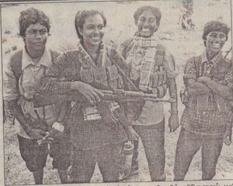
மட்டு. - அம்பாறை விடுவிக்கப்பட்ட பகுதிகளில் விடுதலைப் புலிகளின் மகனர் அணி போராளிகள் கடமையில் ஈடுபட்டுள்ளனர்.

மட்டக்களப்பு, ஏப். 14 மட்டக்களப்பு மாவட்டத்தில் ஏற்பட்ட சகஜநிலையை அடுத்து, இடம் பெயர்ந்த வடபகுதித் தமிழர்கள் தமது இடங்களுக்குத் திரும்புகின்றனர். கருணா குழுவின் அறிவிப்பை அடுத்து வடபகுதியைச் சேர்ந்த சுமார் 5 ஆயிரம் பேர் வெளியேறியிருந்தனர். கிழக்கில் சகஜநிலை ஏற்பட்டதை அடுத்து அவர்களில் பெரும் எண்ணிக்கையானவர்கள் நேற்றுத் தமது இடங்களுக்குத் திரும்பினர். அவர்கள் தமது வீடுகளைச் சுத்தம் செய்யும் பணியில் ஈடுபட்டிருந்தனர். அதேவேளை, மட்டக்களப்பில் இருந்து வெளியேறிய நூற்றுக்கணக்கான யாழ்ப்பாணத்தவரான வந்தகர்களில் 25 இற்கு மேற்பட்டவர்கள் திரும்பியுள்ளனர். அவர்களில் சிலர் தமது கடைகளை நேற்றுத்திறந்து விவியாரத்தை ஆரம்பித்திருந்தனர். (ம-3-21)