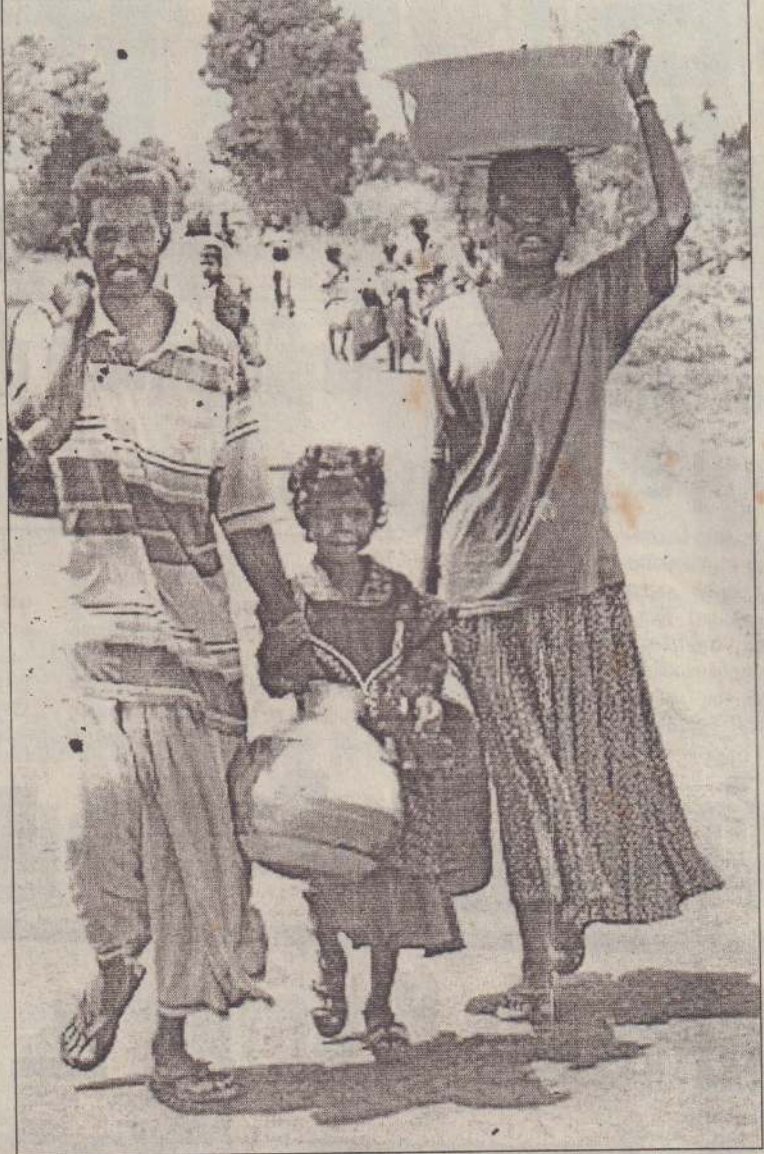
விடுதலைப் புலிகளுக்கும் கருணா குழுவினருக்கும் கிடையிலான மோதல்களைத் தொடர்ந்து கிடம்பெயர்ந்திருந்த மக்கள் தமது சொந்த கிடங்களுக்குத் திரும்பும் காட்சி.

குறித்தும் இந்த நிலைமையால் ஸ்ரீ.மு.காவின நிலைப்பாடு குறித்தும் மகாநாயக்கருக்கு விளக்கிக் கூறும் முகமாகவே ரவூப் ஹக்கீம் தேரரை சந்தித்தார். அப்போது தேரர் மேலும் கூறியதாவது:- அண்மையில் நடைபெற்ற தேர்த லில் இரு பிரதான கட்சிகளும் எதிர் பாத்த எண்ணிக்கையிலான ஆசனங் களைப் பெறத் தவறியுள்ளன. ட்சி கள் ஓரளவு புரிந்துணர்வோடும் ஒரு மைப்பாட்டோடும் செயற்படத் தவறி னால் நாடு, இரண்டொரு வருடத்துக் குள் மற்றொரு பொதுத் தேர்தலை