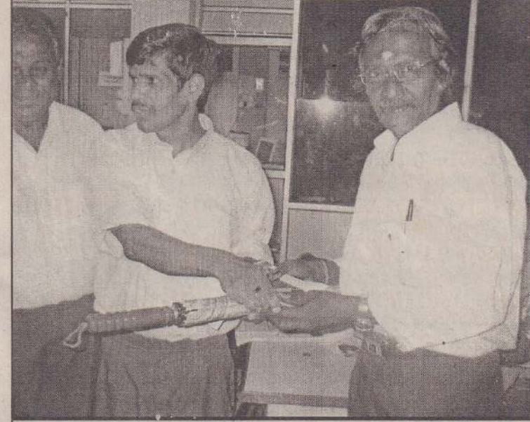
இலங்கை வங்கியின் மேற்காக்கீளை, வர்த்தக வங்கியின் யாழ்ப்பாணம், கிளை, தேசிய சிமெந்து வங்கியின் யாழ்ப்பாணம், கிளை, மக்கள் வங்கியின் கன்னாட்டிக்கிளை ஆகியவற்றில் புதுவருடத்தை யொட்டி நேற்றுமுன்தினம் புதன்கிழமை நடைபெற்ற கொடுக்கல் வாங்கல்கள்போது எடுக்கப்பட்ட படங்கள்.