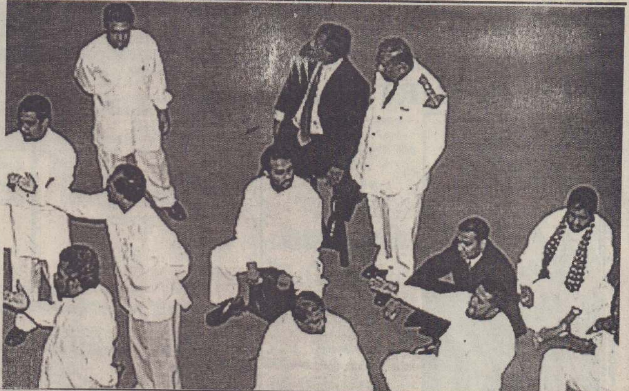
18 ஆவது நாடாளுமன்றின் முதலாவது அமர்வன்போது கிடம்பெற்ற சபாநாயகர் தெரிவில் ஏற்பட்ட அமளிதமளியை அடுத்து அரசு தர்ப்பு நாடாளுமன்ற உறுப்பினர் ஒருவர் வாக்குப் பெட்டியின் மேல் அமர்ந்திருப்பதையும் ஏனையோர் வாக்குவாதத்தில் ஈடுபடுவதையும் படத்தில் காணலாம்.

அமைதி முறையில் - சமாதான வழியில் - கிணக்கத் தீர்வு என்பது ‘கானல் நீராகவே’ முடியுமோ என்ற அச்சத்தை வலுப்படுத்தும் - மேலும் உறுதிப்படுத்தும் - வகையில் அமைந்துள்ளன.