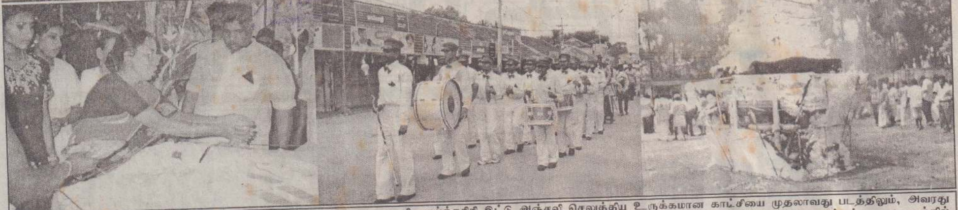
மறைந்த ஊடகவியலாளர் ஜி.நடேசனின் புகழுடலுக்கு அவரது மனைவி வாங்கிக் கிட்டு அஞ்சலி செலுத்திய உருக்கமான காட்சியை முதலாவது படத்திலும், அவரது கிறித்த ஊர்வலம் பாடசாலை மாணவர்களின் பாண்டி வாத்திய கிசையுடன் நகர்ந்து செல்வதை கிரண்டாவது படத்திலும், நடேசனின் சாரம் வதிர ஆலங்கட்டை மயானத்தில் தீயுடன் சங்கமாவதை முன்றாவது படத்திலும் காணலாம்.