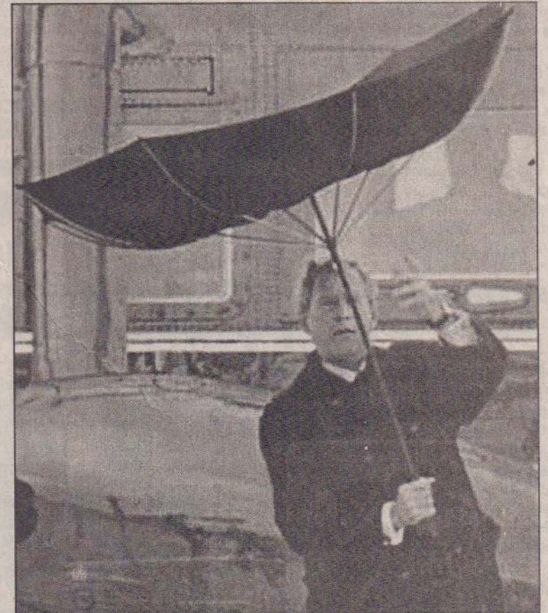
அமெரிக்காவின் சில மாகாணங்களில் சூறாவளி காற்றுடன் பலத்த மழை பெய்தது. அப்போது அதிர் ஜோர்ஜ் புஷ் கொலோராடோவுக்கு செல்ல ராணுவ விமானத்தில் ஈரப்பட்டார். அதிர் புஷ் வருகிறார் என்பதற்காக சூறாவளிக் காற்று பயந்துவிடும் என்ன சமூன்று அடித்த சூறாவளிக் காற்றில் புஷ் பிடித்திருந்த குடை வளைந்து நெளிந்து உருத்தெரியாமல் போய்விட்டது. குடையுடன் சிறிதுநேரம் போராடிய புஷ் நணைந்துகொண்டே விமானத்துக்குள் ஏறினார்.

கடந்த சில நாட்களுக்கு முன்பு சவுதி அரேபியாவில் அல்கெய்டா தீவிரவாதிகள் எண்ணெய் நிறுவனம் மீதும், குடியிருப்புகள் மீதும் தாக்குதல் நடத்தியதில் 22 பேர் பலியானார்கள். இந்தச் சம்பவத்தைத் தொடர்ந்து சவுதி அரேபியாவில் பணியாற்றும் வெளிநாட்டவர்கள், எண்ணெய் நிறுவன ஊழியர்கள் சொந்த நாடு திரும்புகிறார்கள். இதனால், எண்ணெய் உற்பத்தியும் சவுதி அரேபியாவில் பாதிப்பை ஏற்படுத்தியிருக்கிறது. எண்ணெய் விலையும் அதிகரிக்கும் சூழ்நிலை உருவாகியிருக்கிறது. எண்ணெய் வள நாடுகளில் பதற்றம் ஏற்பட்டுள்ளது. பெற்றோலியா எண்ணெய் பீடபாய் ஒன்றுக்கு 4 ஆயிரம் ரூபாவரை சர்வதேச சந்தையில் அதிகரிக்கும் நிலை உருவாகியுள்ளது. (க)