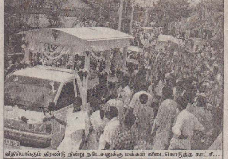
வதியங்கும் திரண்டு நன்று நடேசனுக்கு மக்கள் விடைகொடுத்த காட்சி...

கொழும்பு, ஜூன் 4 மட்டக்களப்பு - அம்பலாந்துறைப் பிரதேசத்தில் நேற்றுக்காலை 8 மணியளவில் கைக்குண்டு ஒன்று வெடித்ததில் இருவர் காயமடைந்துள்ளனர். குண்டைக் கிட்டுந்த கைக்குண்டு ஒன்று திடீரென வெடித்ததாலேயே இந்த அனர்த்தம் ஏற்பட்டது என்று கூறப்பட்டது. காயமடைந்த இருவரும் தற்போது மட்டக்களப்பு போத்தனாவைத்தியசாலையில் சேர்க்கப்பட்டுள்ளனர். (க)