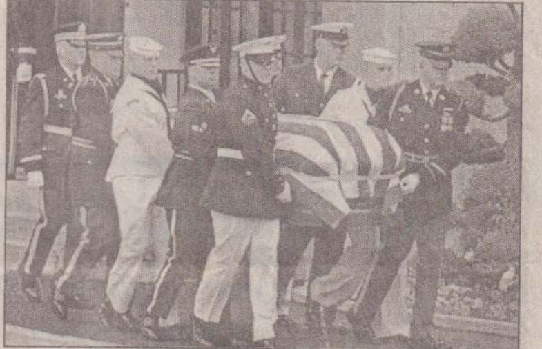
முன்னாள் அமெரிக்க ஜனாதிபதி ரொனால்ட் ரீகனின் புகழவல் புரண கிராணுவ மரியாதையுடன் எடுத்துச் செல்லப்படும் காட்சி.

மேயரின் பல பாதுகாப்பு அதிகாரிகள் காயமடைந்துள்ளனர் என்றும் தெரிவிக்கப்படுகின்றது. (4-8)