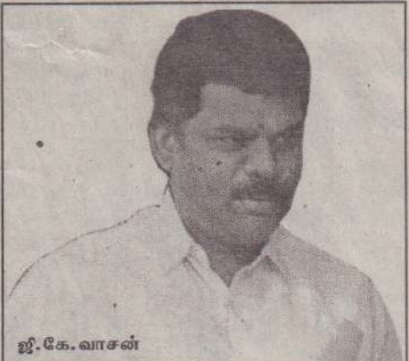
ஜி. கே. வாசன்

வாஜ்பாய் இந்தியப் பிரதமர். அ.தி.மு.க. - பா.ஜ. கூட்டணிக்கு ஆதரவு திரட்ட சென்னை வருகிறார். அவரை சென்னை விமான நிலைமத்தில் சென்று ஜெயலலிதா கட்டாயம் வரவேற்க வேண்டும். நாட்டின் பிரதமரை மாநில முதல்வர் வரவேற்பது மரபு. மேலும் அந்தக் கூட்டணியின் பங்காளியான பா.ஜ. கட்சியின் தேசியத் தலைவர் வாஜ்பாய். எனினும் ஜெயலலிதா வாஜ்பாயை விமான நிலையைச் சென்று வரவேற்கவில்லை. இது வாஜ்பாயை அவமதித்த செயலுக்கு ஒப்பானது என பா.ஜ. கட்சி