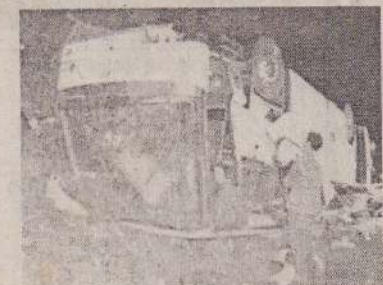
பஸ்ஸில் இருந்து பயணிகளின் உடல்களை பிரான்சு நாட்டு பொலீஸார் மீட்கும் காட்சி.

இந்த பஸ்ஸில் இருந்த சுற்றுலா கப் பயணிகளில் 15 பேர் உடல் நசுங்கி பலியாகினார்கள். 25 இற்கும் மேற்பட்டவர்கள் காயம் அடைந்தனர். தலை குப்புறக் கிடக்கும் அந்த