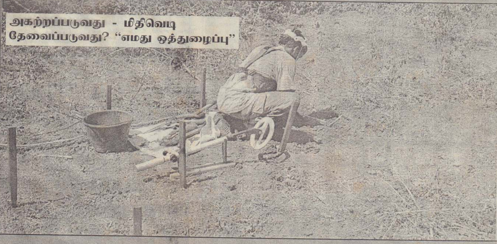
அகற்றப்படுவது - மதிவெடி தேவைப்படுவது? "எமது ஒத்துழைப்பு"