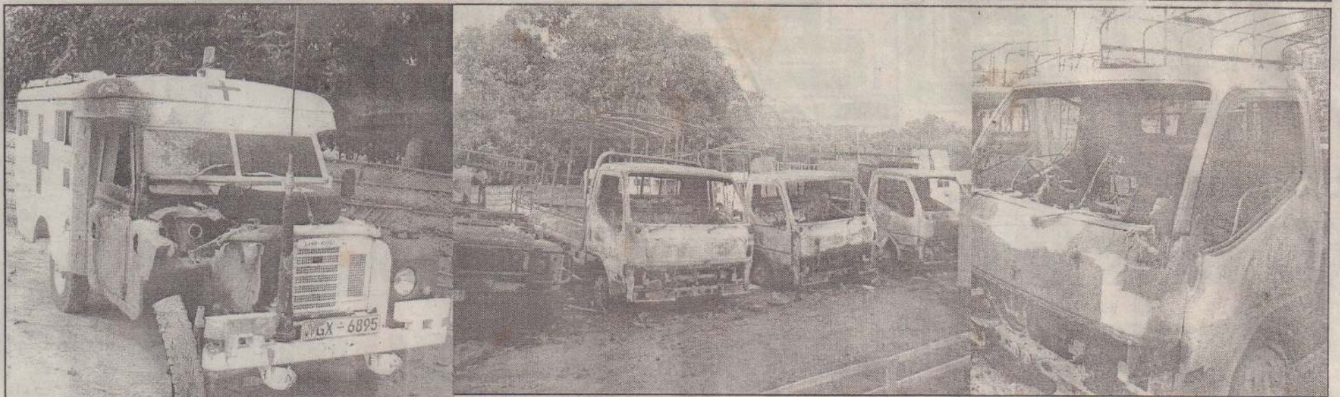
நெற்றுமுன்தினம் நள்ளிரவுக்குப் பின்னர் கிளந்தெரியாத கும்பல் ஒன்றினால் எரியூட்டப்பட்ட 'ஹோ ரஸ்ட்' கண்ணை அகற்றும் நிறுவனத்தின் வாகனங்களைப் படங்களில் காண்கிறீர்கள். நல்லூர் குறுக்கு வீதியில் உள்ள நிறுவனத்தின் வாகனத் தரிப்பிடத்தில் வைத்தே வாகனங்கள் எரிக்கப்பட்டன.