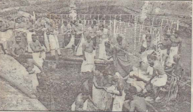
யாழ். வண்ணை கன்னாதிட்டி ஸ்ரீ காள் அம்பாள் ஆலய தேர் முட்டி கட்டுவதற்கான அடிக்கல் நடும் விழா அண்மையில் நடைபெற்றபோது எடுக்கப்பட்ட படம். (10)