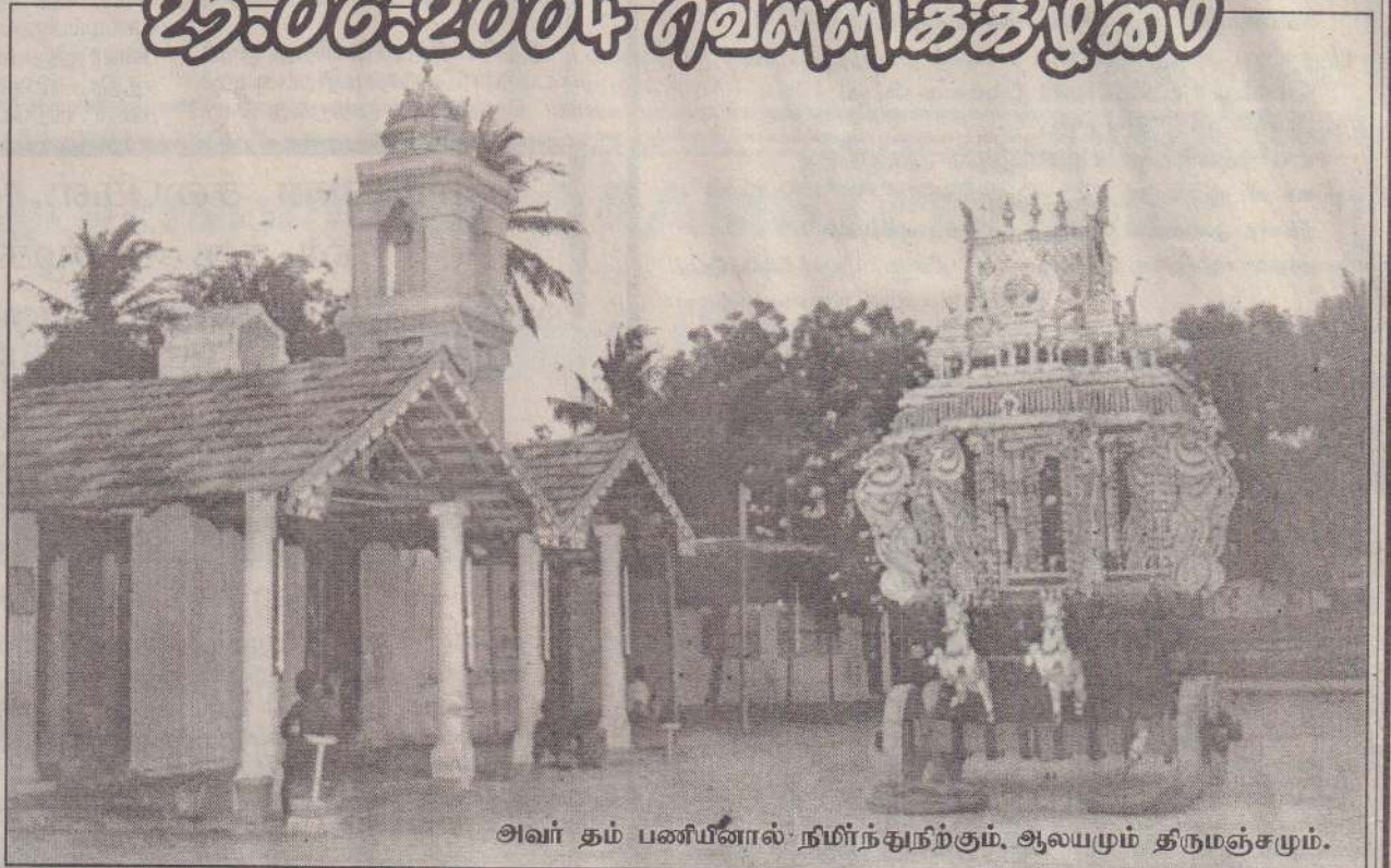
அவர் தம் பணியினால் நமீர்ந்துநிற்கும், ஆலயமும் திருமஞ்சளும்.