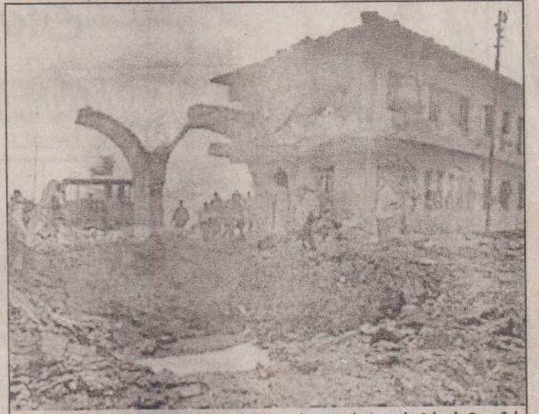
கிளர்ச்சியாளர்களின் கார்க்குண்டுத் தாக்குதலின் கோரம் தீர்ப்பு பொலீஸ் நிலையக் கட்டடத்தை பார்க்கும்போது புகைமுகம்.

ஈராக்கின் அனைத்துப் பகுதிகளிலும் அமெரிக்கப் படையினரும் பொலீஸாரும் உசார்நிலையில் வைக்கப்பட்டுள்ளனர். (ப-8)