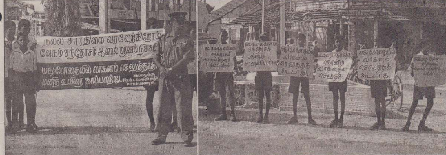
சாரதிகள் நல்லொழுக்க வாரத்தையொட்டி சாவகச்சேரி பொலீஸரால் நேற்றுமுன்தினம் நடத்தப்பட்ட வீதி ஒழுங்கு விதிகள் குறித்த செயன்முறைகளின்போது எடுக்கப்பட்ட படங்கள்.

யாழ்ப்பாணம், ஜூன் 25 வலி, தென்மேற்கு பிரதேச சபை யின் நூலகங்கள் யாவும் நாளை சனிக்கிழமை முழுநாளும் முடப்பட்ட ிருக்கும் என வலி பிரதேச சபை உள்ளூராட்சி உதவியாளர் தெரி வித்துள்ளார். நூலகங்களில் தொடர்பான பயிற்சி நெறிபில் நூலகங்களின் ஊழியர்கள் கலந்து கொள்ளவுள்ளதால் மேற்படி நூலகங்கள் முடப்பட்டன என பொது மக்களுக்கும் வாசகிகளுக்கும் அவர் தெரிவித்துள்ளார். (10-185)