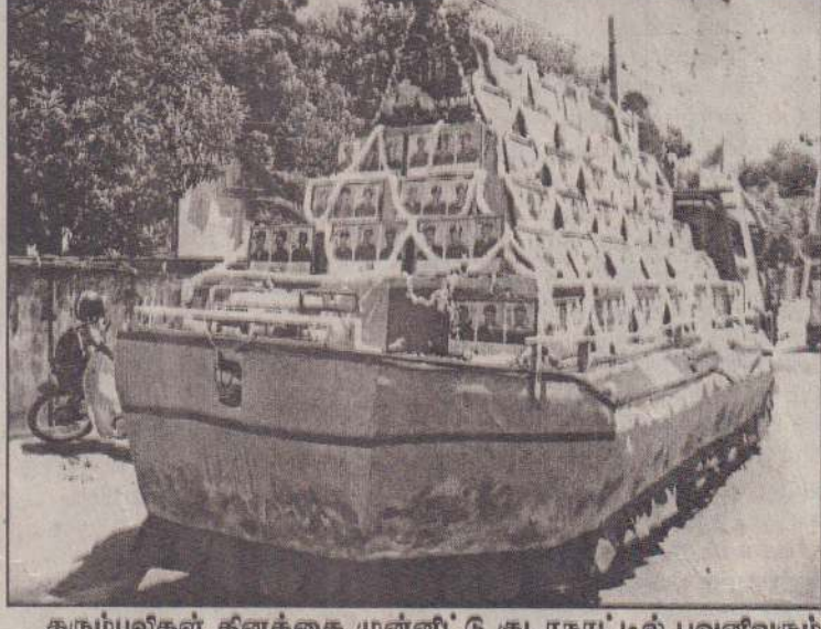
கரும்புலிகள் தினத்தை முன்னிட்டு குடாநாட்டில் பவனிவரும் நினைவு ஊர்தி.

தமிழீழ விடுதலைப் புலிகளின் கரும்புலிகள் தினத்தை நாளை மறு தினம் தமிழ்ப்பிரதேசங்கள் எங்கும் உணர்வுபூர்வமாக அனுஷ்டிப்பதற்கான ஏற்பாடுகளைப் புலிகள் செய்து வருகின்றனர். "தாயக மீட்புப் போரில் தடைகளை அகற்றி ஆகுதியாகிய கரும்புலிகள் நிகழ்வு" - என்ற தலைப்பில் பல்வேறு நிகழ்வுகள் குறித்து அறிவிக்கப்பட்டுள்ளது. வவுனியா, திருகோணமலை, யாழ்ப்பாணம், மட்டக்களப்பு, அம்பாறை, மன்னார் மற்றும் வன்னிப் பகுதிகளில் கரும்புலிகள் தினத்தை அனுஷ்டிக்க விரிவான ஏற்பாடுகள் செய்யப்பட்டு வருகின்றன. இம்முறையும் படையினரின் கட்டுப்பாட்டில் உள்ள தமிழர் பிரதேசங்களிலும் இத்தினம் உணர்ச்சிபூர்வமாக அனுஷ்டிக்கப்படும் என ஏற்பாட்டுக்குழுக்கள் தெரிவித்தன. கரும்புலிகள் தினத்தை முன்னிட்டு குடாநாட்டெங்கும் பதாகைகள், சிவப்பு - மஞ்சள் கொடிகள் கட்டப்பட்டுள்ளன. சிரமதானங்கள் உட்பட பொதுச் சேவைகளில் பலரும் ஈடுபட்டுள்ளனர். பிரதான அஞ்சலி நிகழ்வுகள் யாழ். குடாநாட்டில் நெல்லியடி மற்றும் புங்குடுதீவு ஆகிய இரு இடங்களிலும் இடம்பெறவுள்ளன. 5ஆம் திகதி மாலை 4.30 மணிக்கு முதற்கரும்புலி மில்லர் ஆகுதியான இடமான நெல்லியடி மத்திய கல்லூரி மில்லர் சதுக்கத்தில் கரும்புலிகளின் பிரதான நிகழ்வுகள் இடம்பெறவுள்ளன. நெல்லியடிச் சந்தியில் இருந்து அலங்கரிக்கப்பட்ட ஊர்தியில் கரும்புலிகளின் திருநெடுவட்டங்கள் பாண்ட (16ஆம் பக்கம் பார்க்க)