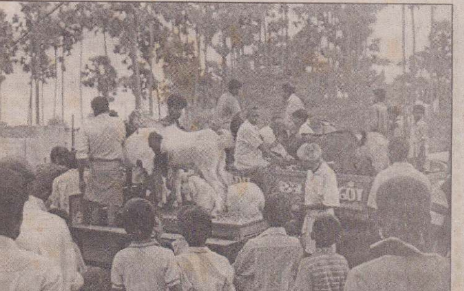
நவால் தெற்கு - தம்பனை மாரியம்மன் ஆலய வேள்வி அண்மையில் இடம்பெற்றது. இந்த வேள்வியில் கடாக்கள் பலியிடப்படுவதற்காக டிராக்டர்கள் மற்றும் லான்ட் மாஸூர்களில் கொண்டுவரப்பட்டு ஆலய முன்றலில் நிறுத்தப்பட்டிருப்பதைப் படத்தில் காணலாம். (10-185)

துவர் இன்று பார்வையிடமாட்டார், நாளை வருங்கள்' என்று கூறிய திருப்பி அனுப்பிவிடும் நிலைமையும் காணப்படுவதாகவும் - நோயாளிகள் தரப்பில் கூறப்படுகிறது. மேற்படி வைத்தியசாலையில் நோயாளர் மருந்துகள் எழுதவதற்கான காசிதாதி இல்லை என்ற அறிவித்தல் எதுவும் பொதுமக்கள் பார்வைக்கு வைக்கப்படவில்லையென்பதும் குறிப்பிடத்தக்கது. (ஏ-86)