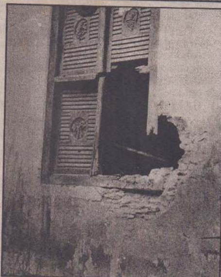
கம்பலையுமாக இடம்பெயர்ந்து கொண்டிருந்தனர். மாட்டுவண்டிகளிலும், சைக்கிள்களிலும், கால்நடையாகவும், லான்ட் மாஸ்டர்களிலும் வட்டுக்கோட்டை, நவாலி வீதி, வழக்கையாறு வெளி, நவாலி - ஆணைக்கோட்டை பிரதான வீதி, கட்டுடை - மாணிப்பாய் பிரதான வீதி ஆகியவற்றின் வழியாக அவர்கள் சென்றனர். அவ்வேளையில் சகல வீதிகளிலும் தாக்குதல்கள் நடந்தன. வீதிக்குவீதி சடலங்கள்,

அன்றையதினம் காலை வலிகாமம் பகுதியில் உள்ள மக்கள் உடுத்த உடைகளுடனும், அகப்பட்ட உடைமைகளுடனும் கண்ணீரும்