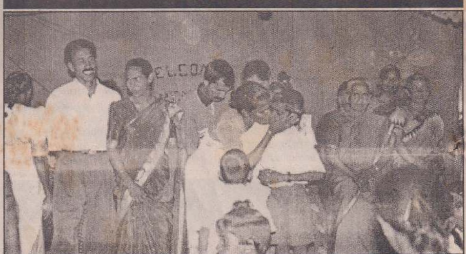
மாதகல் சென்.தோமஸ் நோ.க. பெண்கள் பாடசாலையில் நடைபெற்ற பெற்றோர் தின விழாவில் கலந்துகொண்ட பெற்றோர்களையும் மாணவர்களையும் படத்தில் காணலாம்.