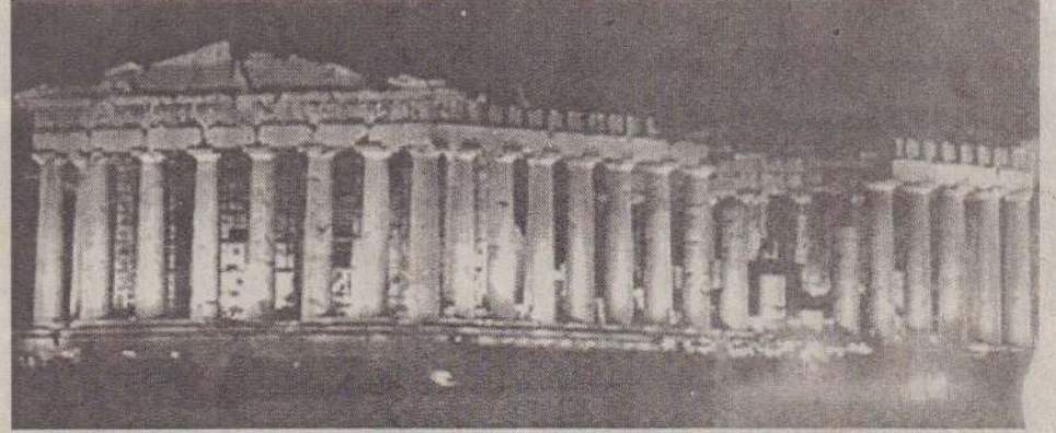
ஏதென்ஸ் நகரில் அடுத்த மாதம் நடக்க உள்ள ஒலிம்பிக் போட்டியையொட்டி சுற்றுலா பயணிகளை கவர்வதற்காக பூமும் பெரும் பார்த்தினன் ஆலயம் மீன் விளக்குகளால் ஒளியூட்டப்பட்டு ஜொலிக்கிறது.

கத்துவ நாடுகளும் 15 தற்காலிக உறுப்பு நாடுகளும் அங்கம் வகிக்கும் ஐ.நா. பாதுகாப்புச் சபைக்கே அதற்கான அதிகாரம் உண்டு. ஆயினும் இஸ்ரேலுக்கு எதிரான இந்தத் தீர்மானம் பாதுகாப்புச் சபையில் நிறைவேற்றப்படுவதை அமெரிக்கா தனது ரத்து அதிகாரத்தைப் பயன்படுத்தித் தடுத்து விடும் என்று கூறப்படுகிறது. (ஒ)