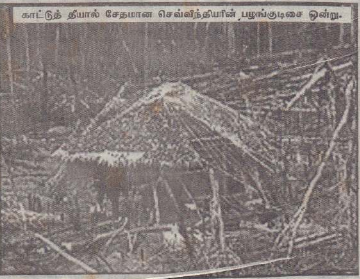
காட்டுத் தீயால் சேதமான செவ்வீந்தியின் பழங்குடிசை ஒன்று.

அமேஸன் காட்டின் பெரும் பகுதியில் ஏற்பட்டுள்ள அழிவு காரணமாக உலகம் மிகப்பெரிய காபனீரொட்சைட் மாசு அச்சுறுத்தலை எதிர்நோக்கியுள்ளது. விஞ்ஞானிகள் கூறுகின்றனர். காட்டுத் தீயினாலும் மற்றும் மரக்களை வெட்டி அகற்றுவதாலும் உள்நாட்டுக் குரிய இனங்களும் அழிவடைவதாக அவர்கள் கூறுகின்றனர்.