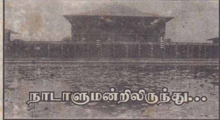
நாடாளுமன்றிலிருந்து... (Caption describing the image)

அனூரா பண்டாரநாயக்கா மொட்டைத் தலைக்கும் முழங்காலுக்கும் முடிச்சு போடுவது போல் பேசினார். எதிர்க்கட்சிகள் அனைத்தும் அரசு ஊடகங்களான இலங்கை வானொலி, இலங்கை ரூபவாஹினி, சுயாதீன தொலைக்காட்சி சேவை, லேக்ஹவுஸ் நிறுவனம் என்பன அரசு கட்டுப்பாட்டில் ஆதரவாக செயல்படுவதாகக் குற்றம் சுமத்துகின்றன. "ஆனால், தனியார் ஊடகங்கள் - தமிழ், சிங்கள, ஆங்கில பத்திரிகைகள் அனைத்தும் - ஓட்டு மொத்தமாக எதிர்க்கட்சிகளுக்கு ஆதரவான பிரசாரங்களில் ஈடுபட்டுள்ளன. "இப்படியான நிலையில் அரசு ஊடகங்கள் ஆளும் கட்சிக்கு ஆதரவாகச் செயற்படுவதில்