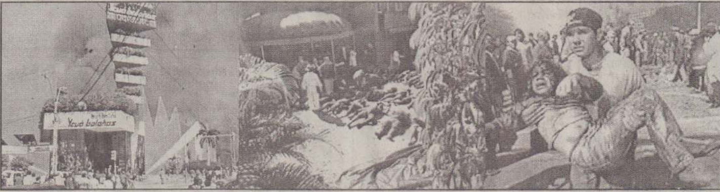
சுப்பமார்க்கெட்டில் ஏற்பட்ட தீ விபத்தினால் அப்பகுதி புகை மண்டலமாகக் காட்சியளிப்பதையும், தீயில் கருகிய சடலங்கள் வெளியே வைக்கப் பட்டிருப்பதையும், விபத்தில் காயமடைந்த சிறுவன் ஒருவனை மீட்புப் பணியாளர் வைத்தியசாலைக்கு எடுத்துச்செல்வதையும் படங்களில் காணலாம்.

சம்பவம் நடந்த இடத்திற்கு வீரந்து சென்ற பராகுவே அதிபர் நிக்கானோர் ருவார்ட்டே இது பெரும் துயரத்துக்குரிய சம்பவம் என்று கூறினார். (ப-8)