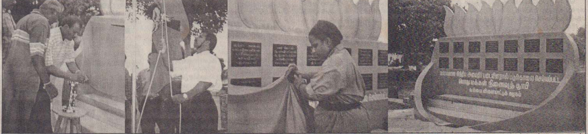
'வல்வைப் படுகொலை' நினைவாக திருவில் அமைக்கப்பட்டுள்ள நினைவுத்துப்பி திறப்பு விழாவில் பொதுச்சுடர், தேசியக் கொடி ஆகியவை ஏற்றப்படுவதையும் நினைவுத்துப்பியையும் படங்களில் காணலாம்.