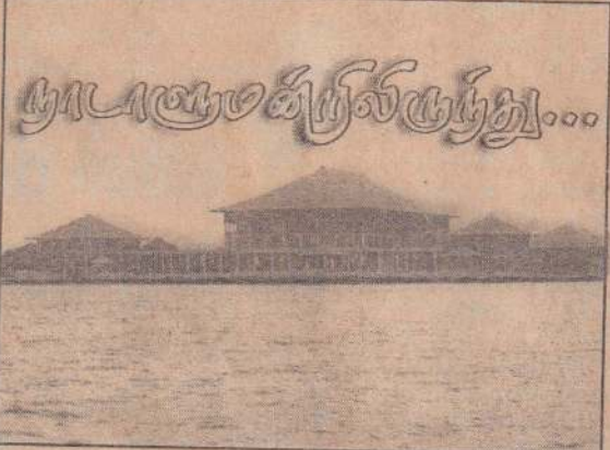
முடிபெய முறுக்கி மல்குந்த புரிய அரசு மற்றும் எதிர்க்கட்சி நாடாளுமன்ற உறுப்பினர்கள் தயாராகினர்.