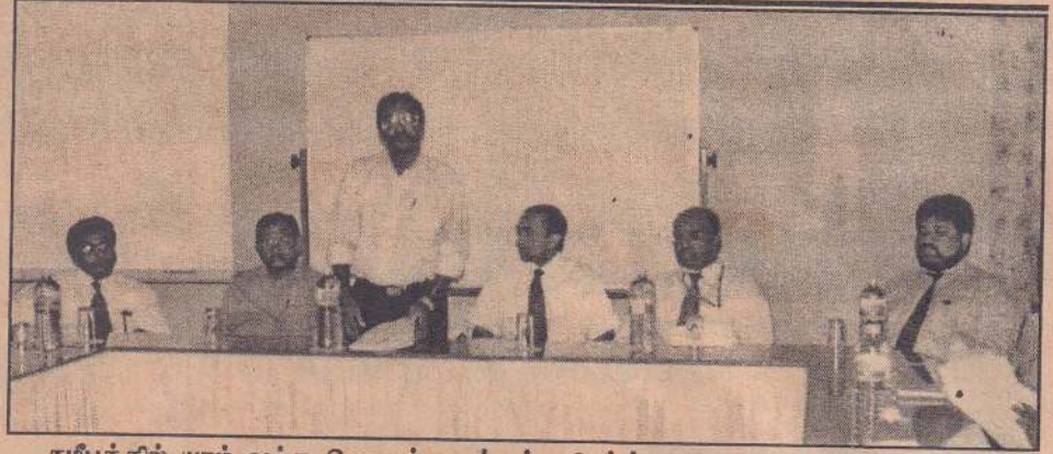
சமீபத்தில் யாழ்ப்பாணம் வந்த கொழும்பு பங்குப் பரிவர்த்தனை பிரதிநிதிகள், யாழ்ப்பாண வர்த்தக கைத்தொழில் மன்றத்தினால் ஒழுங்குசெய்யப்பட்ட ஆய்வுக் கருத்தரங்கில் கலந்துகொண்டனர்.

அமைதிப்பேச்சுகளை மீளத்தொடங்குவதற்கு தமிழ் விடுதலைப் புலிகளும் அரசைப் போலவே பொறுப்புக்களை பகிர்ந்துகொள்ள முன்வரவேண்டும் என்று ஜே.வி.பி. அமைச்சர் அனூரகுமார திஸ்ஸநாயக்க தெரிவித்துள்ளார். இருதர்பிலிருந்தும் அமைதிப்பேச்சின் பால் பற்றுறுதி காணப்படவேண்டும். நாம் அமைதியில் பற்றுறுதி கொண்டுள்ளோம். ஐக்கிய மக்கள் சுதந்திரமுன்னணி போதுமான அளவு தளர்வினைக் காட்டியுள்ளது. விடுதலைப் புலிகளும் அதன் தளர்வுப்பாட்டை வெளிப்படுத்துவதுடன் அமைதிப்பேச்சுகள் தொடர்பாக அதன் பற்றுறுதியையும் வெளிப்படுத்தவேண்டும் என்று தெரிவித்துள்ளார் அமைச்சர் திஸ்ஸநாயக்க. அரசு பேச்சாளர் மங்கள சமரவீரவின் தலைமையில் நடைபெற்ற பத்திரிகையாளர் மாநாட்டில் அவர் மேலும் தெரிவிக்கையில், விடுதலைப் புலிகளின் தளர்விலைப்பாடு