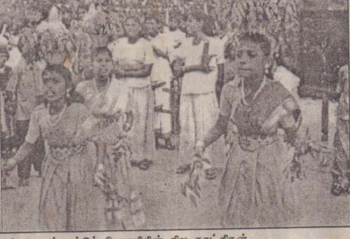
முல்லைத்தீவு கல்வி வலயத்தின் தமிழ்த்தின விழா பண்பாட்டுப் பேரணியின் சில காட்சிகள்.