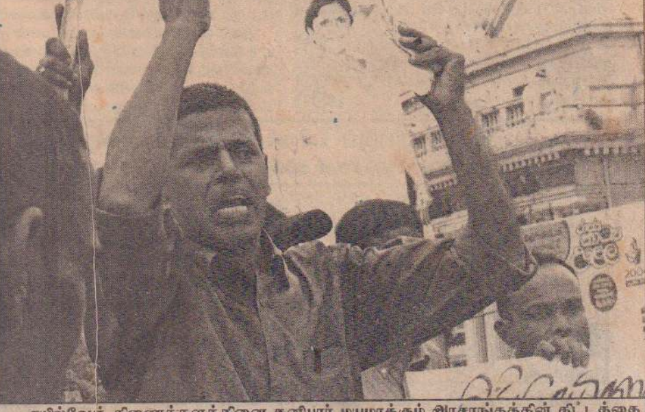
ரயில்வேத் திணைக்களத்தினை தனியார் மயமாக்கும் அரசாங்கத்தின் திட்டத்தை எதிர்த்து நேற்று மருதானை ரயில் நிலையத்தில் ரயில்வே ஊழியர்கள் ஆர்ப்பாட்டத்தில் ஈடுபட்டிருந்தனர்.

அதிகமான ரயில்வே ஊழியர்கள் கலந்துகொண்டனர். தனியார் மயமாக்குவதற்கு வசதியளிக்கும் ரயில்வே அதிகார சபைச்சட்டத்தை அரசு உடனடியாக நீக்கவேண்டும் என போராட்டத்தில் ஈடுபட்டவர்கள் கோரிக்கை விடுத்தனர். ரயில்வேத் திணைக்களத்தில் 17 ஆயிரம் ஊழியர்கள் வரை பணியாற்றுகின்றனர். தனியார் (16ஆம் பக்கம் பார்க்க)