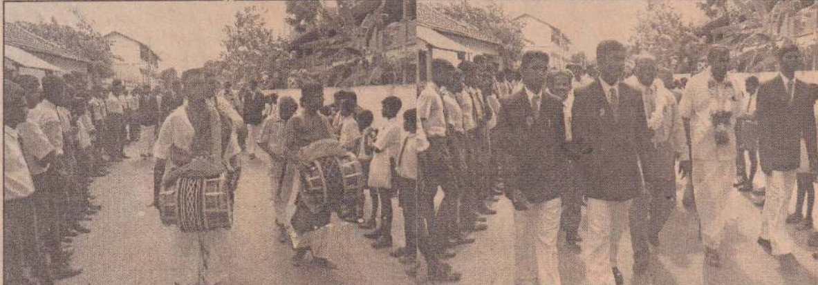
ஆசிரியர் தினத்தை முன்னிட்டு யாழ். மத்திய கல்லூரி அதிபர், ஆசிரியர்கள் மங்கள வாத்தியங்கள் சகிதம் மாணவர்களால் அழைத்து வரப்படுவதைப் படங்களில் காணலாம்.

கட் வேகத்தில் உயர்ந்துவிட்டன. இதனால், மீண்டும் இங்கு 'கியூ' முறை உருவாகப் போவது உறுதி. பட்டினிச்சாவுகளும் சர்வசாதாரணமாகப் போகின்றன. ஆனால், அரசோ இவைபற்றி எதுவும் அலட்டிக்கொள்வதாக இல்லை. அரசுக்கு ஆதரவானவர்களே இன்று அரசிற்கு எதிராகக் கிளம்பிவிட்டனர். ஒன்றுபட்ட மக்களின் குரலுக்கு மிஞ்சிய சக்தி எதுவுமே இல்லை. உடனடியாகப் பொருள்களின் விலைகளைக் குறைக்க நடவடிக்கை எடுக்கவேண்டும். விலைவாசி உயர்வைக் கண்டித்தும் அரச ஊழியருக்குச் சம்பள உயர்வைக் கோரியும் நாம் கொழும்பில் நடத்திய மக்கள் எழுச்சிப் பேரணி பெரிய திருப்பத்தை ஏற்படுத்தியுள்ளது. எனவே, கொழும்புக்கு வெளியே எட்டு முக்கிய நகரங்களில் அரச எதிர்ப்பு - மக்கள் எழுச்சிப் பேரணிகளை நடத்தவேண்டாம். முதற்கட்டமாக பதுளை, பண்டாரவளை, கண்டி, மாத்தளை, நுவரெலியா, குருநாகல் ஆகிய நகரங்களில் நடத்தத் திட்டமிட்டுள்ளோம். இம்மக்கள் எழுச்சிப் பேரணிகளில் சகல எதிர்க்கட்சிகளும் கலந்துகொள்ளவேண்டும் என ஐக்கிய தேசியக் கட்சி அழைப்புவிடுத்துள்ளது. - இப்படி ஜ.தே.க.வின் நாடாளுமன்ற உறுப்பினர்கள் செய்தியாளர் மாநாட்டில் கூறினார்கள்.