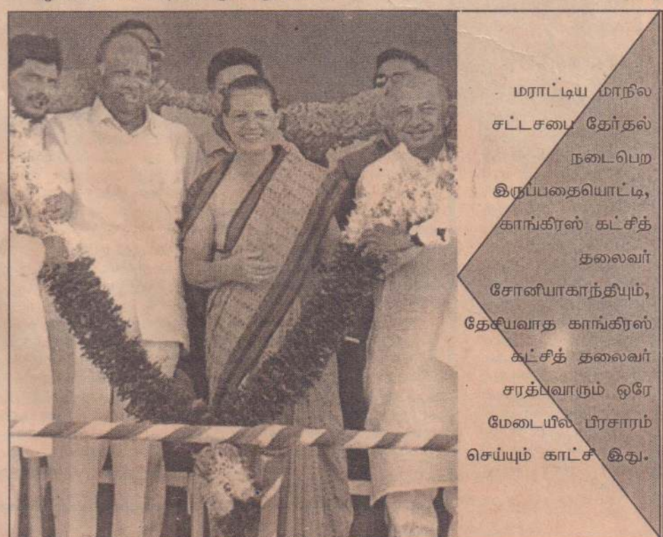
மராட்டிய மாநில சட்டசபை தேர்தல் நடைபெற இருப்பதையொட்டி, காங்கிரஸ் கட்சித் தலைவர் சோனியாகாந்தியும், தேசியவாத காங்கிரஸ் கட்சித் தலைவர் சரத்வாரும் ஒரே மேடையில் பிரசாரம் செய்யும் காட்சி இது.

யாளப்படுத்தப்பட்ட ஒரு பகுதிக்குள் அந்தச் சிறுமி நுழைந்தாள் என்றும், அவள் எடுத்து வந்த பையொன்றில் குண்டிருக்கலாம் என்று சிப்பாய்கள் கருதினார்கள் என்றும் இஸ்ரேலியப்படைத்தரப்பு வட்டாரம் ஒன்று கூறியது. காஸாவின் வடபகுதியில் இஸ்ரேலியப் படையினர் தங்கள் இராணுவ நடவடிக்கையைத் தொடரும் அதேவேளையில் இந்தச் சூட்டுச்சம்பவம் நடந்திருக்கின்றமை குறிப்பிடத்தக்கது. (க-8)