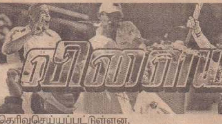
தெரிவுசெய்யப்பட்டுள்ளன. 14 வயதுப் பிரிவில் நெடுந்தீவு மகா வித்தியாலயமும் நெடுந்தீவு சைவப் பிரகாச வித்தியாலயமும் மோதிக்கொண்டதைத் தொடர்ந்து நெடுந்தீவு மகாவித்தியாலயம் சம்பியனாகத் தெரிவு செய்யப்பட்டது. (10-86)

16 வயதுப் பிரிவில் நெடுந்தீவு மகா வித்தியாலயமும் நெடுந்தீவு சைவப் பிரகாச வித்தியாலயமும் மோதிக்கொண்டதையடுத்து நெடுந்தீவு மகாவித்தியாலயம் சம்பியனாகத் தெரிவு செய்யப்பட்டுள்ளது. 18 வயதுப் பிரிவில் நெடுந்தீவு சைவப் பிரகாச வித்தியாலயமும் நெடுந்தீவு மகாவித்தியாலயமும் மோதிக்கொண்டதில் நெடுந்தீவு சைவப் பிரகாச வித்தியாலயம் வெற்றிகொண்டு சம்பியனாகத் தெரிவு செய்யப்பட்டுள்ளது.