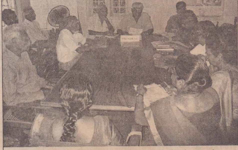
யாழ்ப்பாணம் மாவட்ட பொது அமைப்புகளின் இணையத்தில் இடம்பெற்ற படைத்தளபதியினர் இணையப் பிரதிநிகர்களுக்கான சந்திப்பின்போது எடுக்கப்பட்ட படம்.