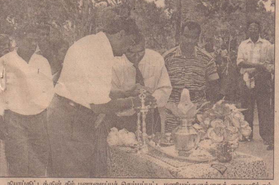
நியாபுட்டத்தின் கீழ் புனரமைப்புச் செய்யப்பட்ட மணியங்குளத்தைக் கையளக்கும் நிகழ்வு அண்மையில் இடம்பெற்றது. நிகழ்வில் அரச அதிபர் தி.கிராசநாயகம் மாங்கல விளக்கேற்றுவதைப் படத்தில் காணலாம்.

வட்டக்கச்சி, ஒக்.7 உயர்தர வகுப்பு மாணவர்களுக்கான புலமைப்பரிசில் பெற தெரிவு செய்யப்பட்ட கிளிநொச்சி வலய மாணவர்களுக்கான புலமைப்பரிசில் கொடுப்பனவு கடந்த 4ஆம் திகதி கிளிநொச்சி வலயக் கல்விப்பணிமனையில் வைத்து வழங்கப்பட்டது. (8-405)