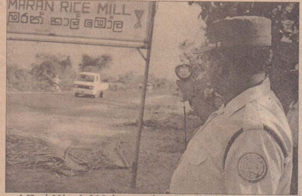
கிளிநொச்சியில் ஏ-9 வீதி உட்பட பல முக்கிய வீதிகளில் விபத்துக்களைத் தடுக்கும் நோக்குடன் தமிழ்த் தேசியக் கல்வி நிறுவனம் வாகனங்களின் வேகக் கட்டுப்பாட்டை நடைமுறைப்படுத்தி வருகின்றனர். ஏ-9 வீதியில் வரும் வாகனம் ஒன்றின் வேகத்தை நவீன வேகக் கண்காணிப்பீட்டுக் கருவி ஒன்றின் மூலம் கண்காணப்படுவதைப் படத்தில் காணலாம்.