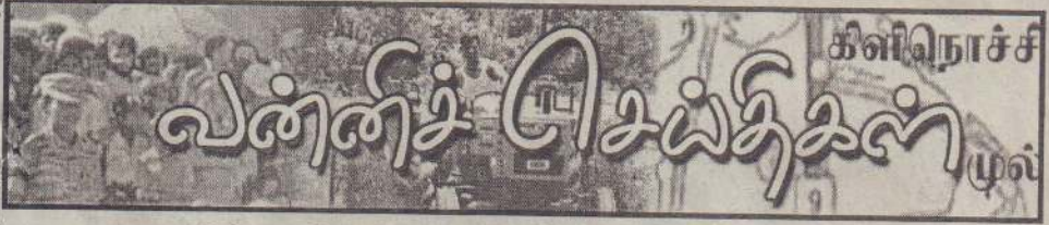
கிளிநொச்சி வள்ளிச் சேவையின்