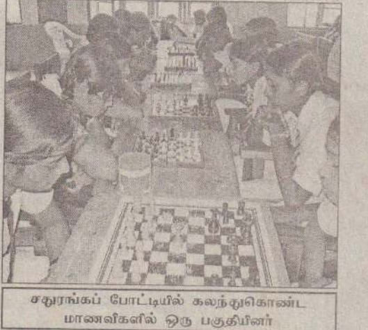
சதுரங்கப் போட்டியில் கலந்துகொண்ட மாணவிகளில் ஒரு பகுதியினர்

இன்றைய போட்டியில் மாலை 5.00 மணிக்கு யாழ். பற்றீரியன் அணியை எதிர்த்து வட்டுக்கோட்டை யாழ்ப்பாணக் கல்லூரி 'A' அணி மோதவுள்ளது. (8)