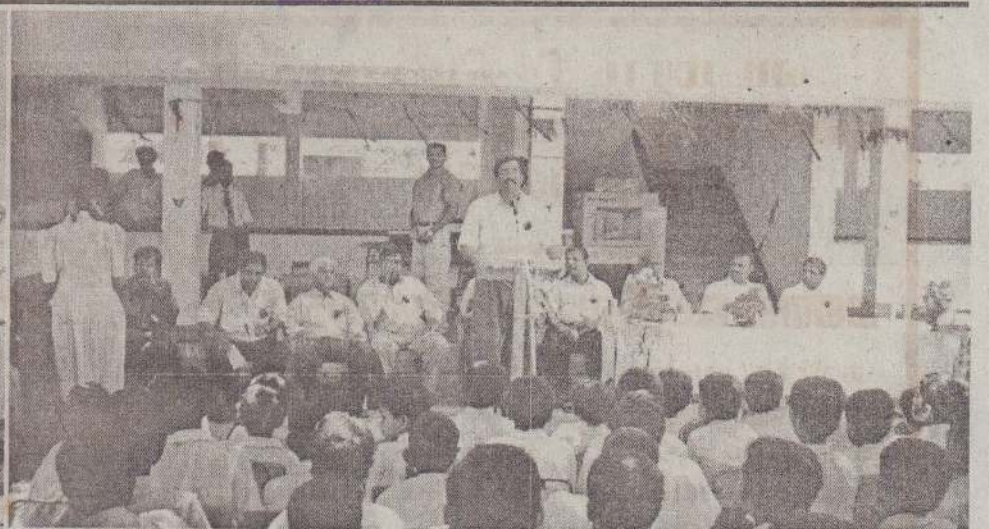
புனகரி, நல்லூர் மகாவித்தியாலயத்தில் புதுதாக அமைக்கப்பட்ட கிரண்டு மாடிகள் கொண்ட கட்டடத் திறப்புவிழா அண்மையில் நடைபெற்றது. புதிய கட்டடத்தின் தோற்றத்தை முதற்படத்திலும் அரசியல்துறை துணைப் பொறுப்பாளர் சோ.தங்கன் உரையாற்றுவதையும் விருந்தினர்கள் உட்பட நிகழ்வில் கலந்துகொண்டோரில் ஒரு பகுதியினரை அடுத்தபடத்திலும் காணலாம்.