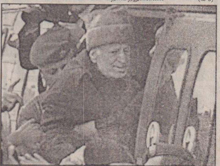
மருத்துவமனைக்கு கொண்டு செல்வதற்காக அரபாத் ஹெலிக் ஏற்றப்படுகிறார்