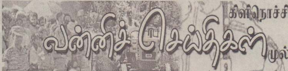
கிளிநொச்சி வன்னிப் பெய்தகம் முல்லைத்தீவு

மாதாந்தம் இரண்டாவது செவ்வாய்க்கிழமையே இக்கூட்டம் நடைபெறுவது வழக்கமாகும். இதன்படி நேற்று நடைபெறவேண்டிய இக்கூட்டம் 23ஆம் திகதி காலை 10 மணிக்குச் செயலக மாநாட்டு மண்டபத்தில் நடைபெறும் எனவும், இதில் அனைத்து உறுப்பினர்களையும் கலந்துகொள்ளுமாறும் அரச அதிபர் கேட்டுள்ளார். (8-405)