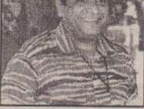
யுள்ள அனுதாபச் செய்தியிலேயே தலைவர் பிரபாகரன் இப்படிக் குறிப்பிட்டுள்ளார். அச்செய்தியில் தெரிவிக்கப்பட்டுள்ள தாவது:-