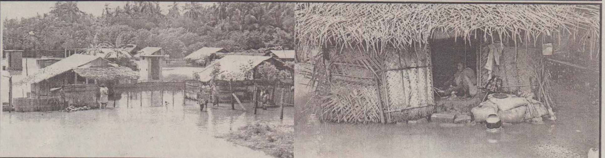
குடாநாட்டில் தொடர்ந்து பெய்து வரும் மழை காரணமாக தாழ்ந்த பகுதிகளில் வெள்ளம் தேங்கியுள்ளதுடன் குடிசைகளில் வசிப்பவர்களும் கிடனால் பெரும் சிரமங்களை எதிர்நோக்கியுள்ளனர். யாழ் - மானிப்பாய் வீதியில் உள்ள கல்லப்பூறா வயல் பகுதியில் மழைவெள்ளத்துக்குள் வாழ்க்கை நடத்தும் மக்களைப் படங்களில் காணலாம்.