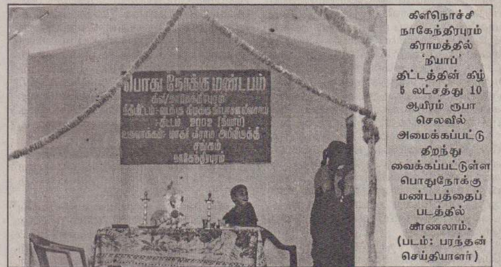
கிளிநொச்சி நாகேந்திரபுரம் கிராமத்தில் 'நயாப்' திட்டத்தின் கீழ் 5 லட்சத்து 10 ஆயிரம் ரூபா செலவில் அமைக்கப்பட்டு திறந்து வைக்கப்பட்டுள்ள பொதுநோக்கு மண்டபத்தைப் பத்தல் சாணலாம்.