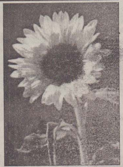
தியாவில் சூரியகாந்தி விதைக்கு அதிக கிராக்கியுண்டு. அங்கு சூரியகாந்தி எண்ணெய்

பிறநாடுகளில் இருந்து இறக்குமதி செய்யப்படும் சூரியகாந்தி எண்ணெய்ப்போத்தல் ஒன்று ரூபா 225 ஆகும். இது அதிக விலையாகும். உணவுத் தேவைக்குத் பயன்படும் எண்ணெய்ப் பயிர்களை உற்பத்திசெய்ய இங்கு வசதிகள் ஏராளம் உண்டு. அப்படியான நிலை இருக்கும்போது அவற்றைப் பிறநாடுகளில் இருந்து இறக்குமதி செய்ய அதிக பணச்செலவு செய்வதில் அர்த்தம் ஏதுமில்லை. இலங்கையில் இப்பயிர்வகைகளை உற்பத்திசெய்து இங்