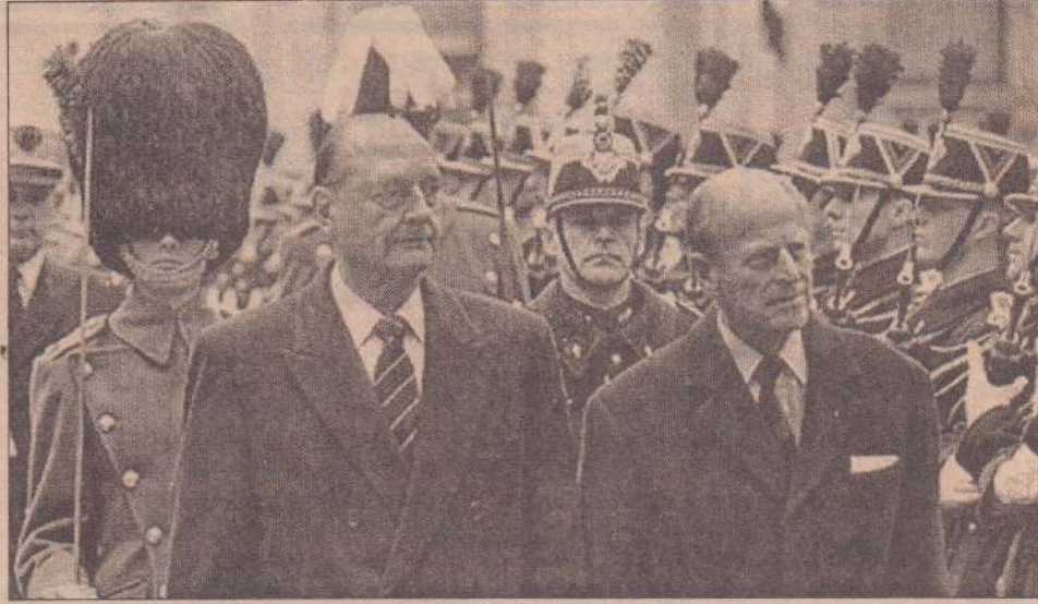
லண்டனில் வெளிப்புற அலுவலகத்தில் அளிக்கப்பட்ட கிராணுவ மரியாதையை ஏற்றுக் கொள்ளும் பிரான்ஸ் அதிபர் ஜக் ஷிராக் மற்றும் ஜர்ஷ் அதிபர் எடின்பரோ.