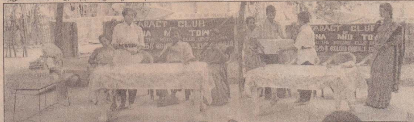
யாழ்ப்பாணம் மாவட்டத்தில் கழக உறுப்பினர்கள், சர்வதேச மாவீரர் பேரவையின் அலுவலகத்தில் கிளிநொச்சி 'செஞ்சோலை', கைவேள் 'காந்தரூபன்' அறிவுச்சோலை ஆகிய சிபுவர் கிள்கள்களுக்குச் சென்று 3 நாள் கல்விப் போதனைகளை நடத்தி அச்சிபுவர்களுக்கு கற்றல் உபகரணங்களை அன்பளிப்புச் செய்தபோது எடுக்கப்பட்ட படங்கள்.