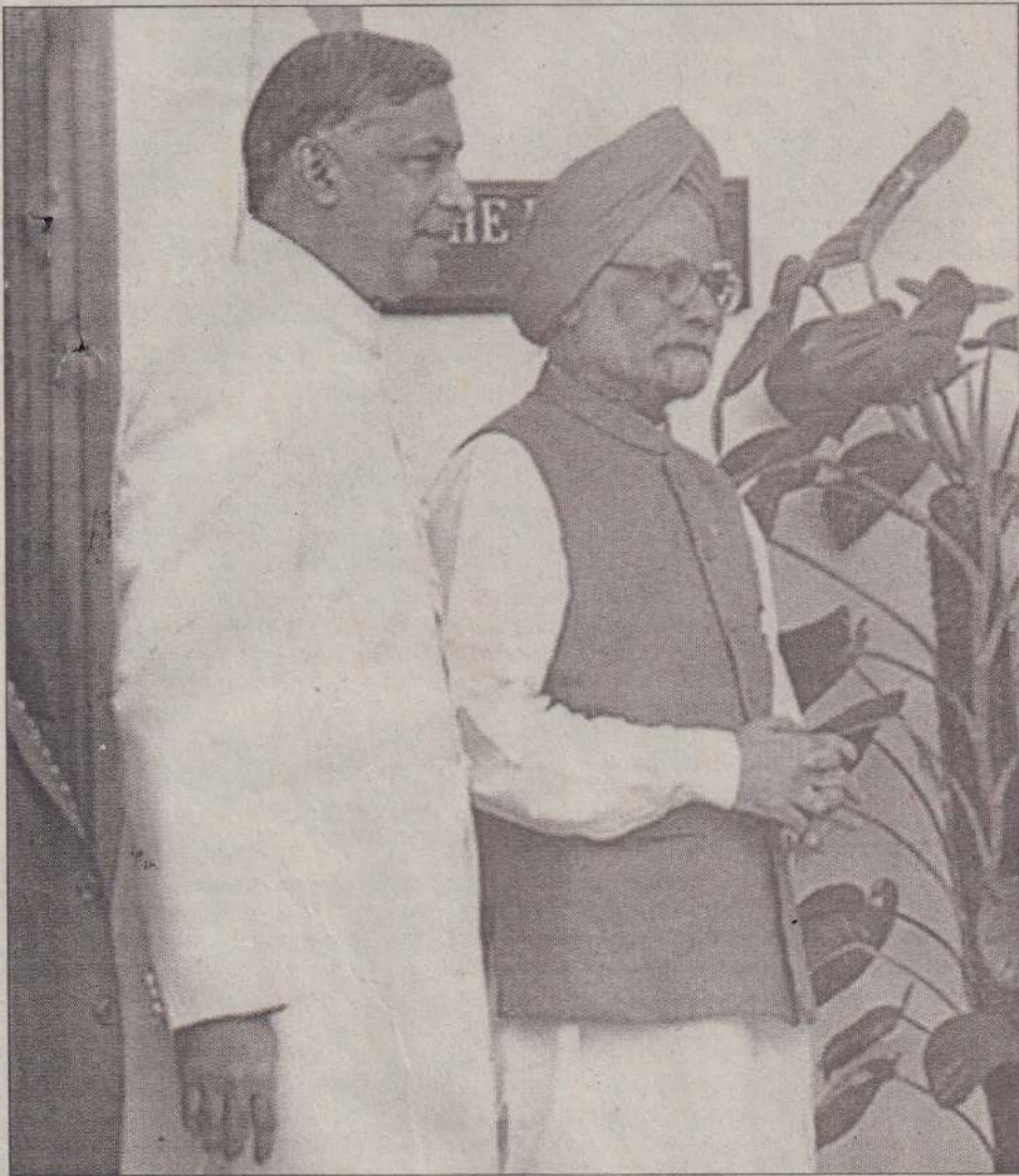
பாகிஸ்தான் பிரதமர் செளகத் அசீஸ், இந்தியப் பிரதமர் மன்மோகன் சிங்கை நேற்று சந்தித்துப் பேச்சுக்கள் நடத்தினார். பேச்சு முடிந்த பின்னர் சிவனும் மண்டபத்தைவிட்டு வெளியேறுவதைப் படத்தில் காணலாம்.