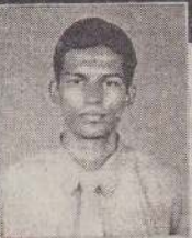
F.C. நிருஷன் யாழ்ப்பாணம்

# 100, Clock Tower Road, Jaffna. P No. : 021 222 2831 / 021 222 6933