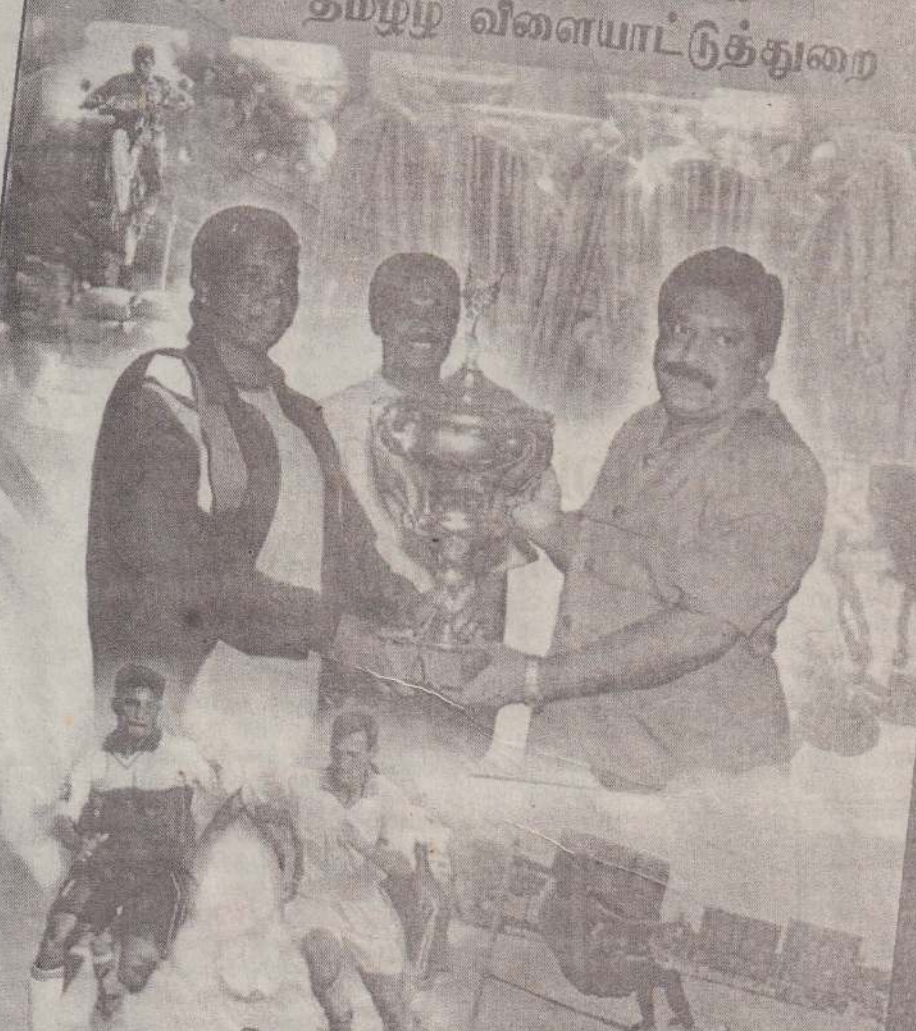
வெள்ளிப்பெட்டிப் பரிட்சைத் தமிழீழ விளையாட்டுத்துறை தமிழீழம்.

50 ஆவது அகவை காலும் தேசியத் தலைவரின் சந்தனையில் தமிழீழ விளையாட்டுத்துறை