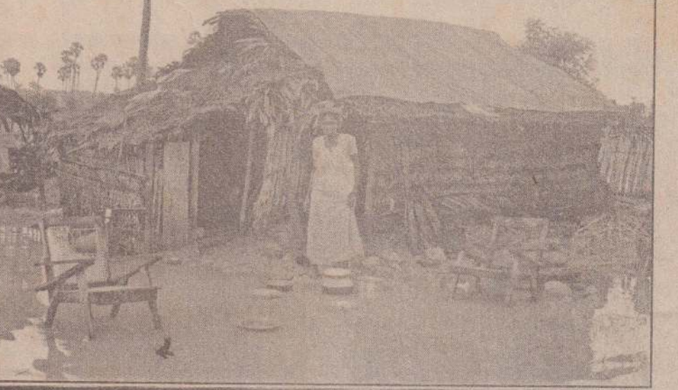
தொடர்ச்சியாகப் பெய்த மழைகாரணமாக வேல்கையில் உள்ள சரவணை மேற்கு பகுதியில் பல வீடுகளுக்குள் வெள்ளம் உட்புகுந்துள்ளது. அவ்வாறு வெள்ளம் உட்புகுந்துள்ள ஏழைக் குடும்பம் ஒன்றின் வீட்டினைப் படத்தில் காணலாம்.