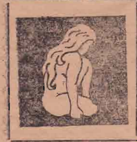
நமது சிரி க(வி)தை

தாயார் உடுப்பது சின்னளம் பட்டு தனியாக உண்பதோ பத்துக் குழல் புட்டு வாயாலே பேசி வழங்குவாள் குட்டு, வதைப்பாளே கணவனை நெருப்பினில் சுட்டு!