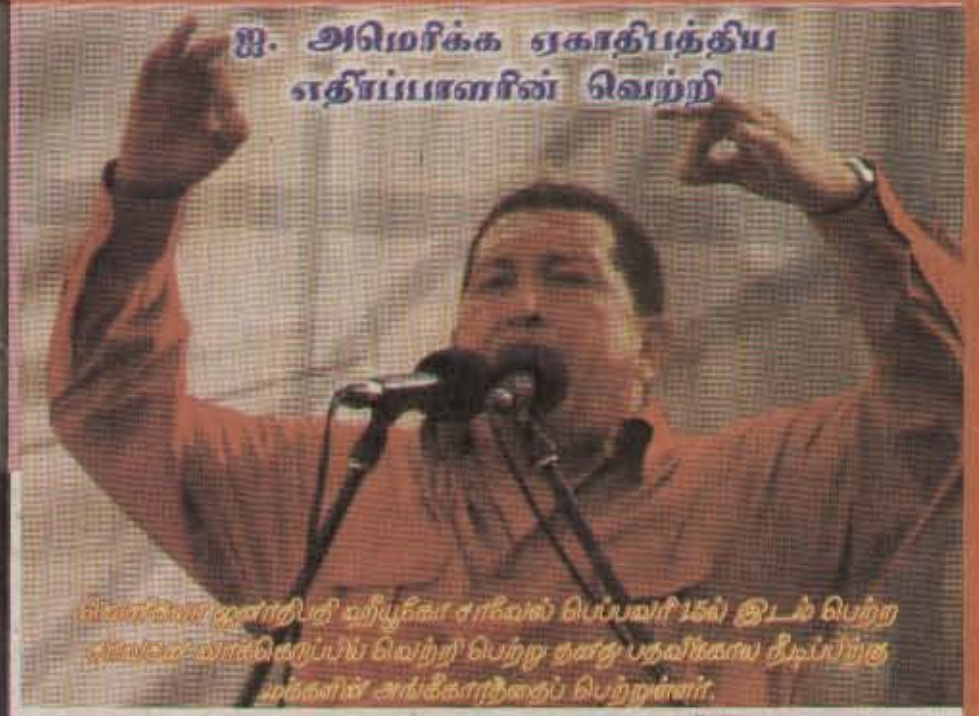
ஐ. அமெரிக்க ஏகாதிபத்திய எதிர்ப்பாளரின் வெற்றி

வெள்ளிகாண்டித்தி கறியூதிகா சரிவால் பெப்பவரி 15ல் இடம் பெற்ற சுவீடன் வாக்கெடுப்பில் வெற்றி பெற்ற தனது பதவிகளைய நீடிப்பிற்கு மக்களின் அங்கீகாரத்தைப் பெற்றதுள்ளார்.