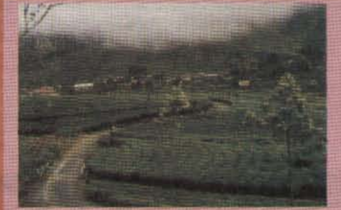
இலங்கையின் ஏற்றுமதிப் பொருளாதாரத்தின் முக்கிய பங்கு வகிப்பது பெருந்தோட்டத்துறையாகும். முன்பு பிரித்தானிய வெள்ளையரிடமும் பின்னர் அரசாங்கத்திடமும் அதன் பின்

நிலைமை ஏகாதிபத்தியத்தினதும் வல்லரசுகளினதும் தேவை விருப்பம் என்பவற்றின் அடிப்படையில் ஐ.நா சபை நாடுகள் மீது அழுத்தங்களை தலையீடுகளை எடுத்து வருகிறது. நாக, ஆப்கான் போன்ற நாடுகளில் அமெரிக்கா நேரடியாகவே தலையீட்டை அளிப்பதான நடவடிக்கைகளில் ஏதாவதொன்றைப் போன்று இலங்கை அரசாங்கத்திற்கு அழுத்தங்களை கொடுக்க முடியுமா என்பதே தமிழகர்கள் சார்பாகச் சிந்திக்கப்படுகிறது. அதற்கான முயற்சிகள் தமிழர்கள் புலம் பெயர்ந்த நாடுகளில் மேற்கொள்ளப்படுகின்றன. நேர்வேயின் சமாதான முயற்சிகளைத் குழப்புவதில் இந்திய மேலாதிக்கம் நேரடியாகவும் மறைமுகமாகவும் இறங்கிப்பது என்பதோடு இலங்கை அரசாங்கம் முன்னெடுத்து வரும் இராணுவ நடவடிக்கைகள் இந்திய மேலாதிக்கத்தினதும் இலங்கை அரசாங்கத்தினதும் கூட்டு முயற்சி என்பதால் இலங்கை அரசாங்கத்தின் மீது மேற்படி அழுத்தங்களை கொடுக்க இந்தியா இடம் அளிக்காது. Zir பக்கம்