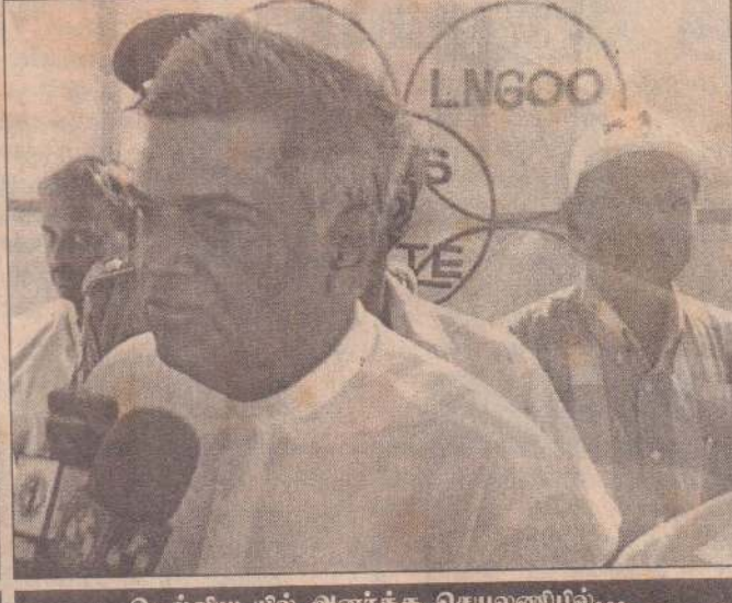
நெல்லியடியில் அனர்த்த செயலணியில்...