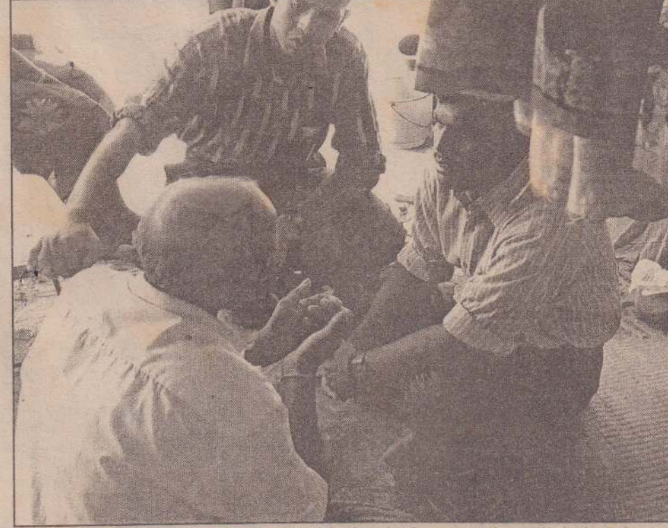
சனாமி அனர்த்தம் நிகழ்ந்த வடமராட்சி மற்றும் வன்னிப் பகுதிகளில் பாதிக்கப்பட்ட மக்களை ஆற்றுப்படுத்தும் அரங்காடல்களில் ஈடுபட்டிருக்கும் ஆசிரிய மாணவர்கள் நலன்புரி முகாம் ஒன்றில் பாதிக்கப்பட்டவர்களை உரையாடுவதைப் படத்தில் காணலாம்.