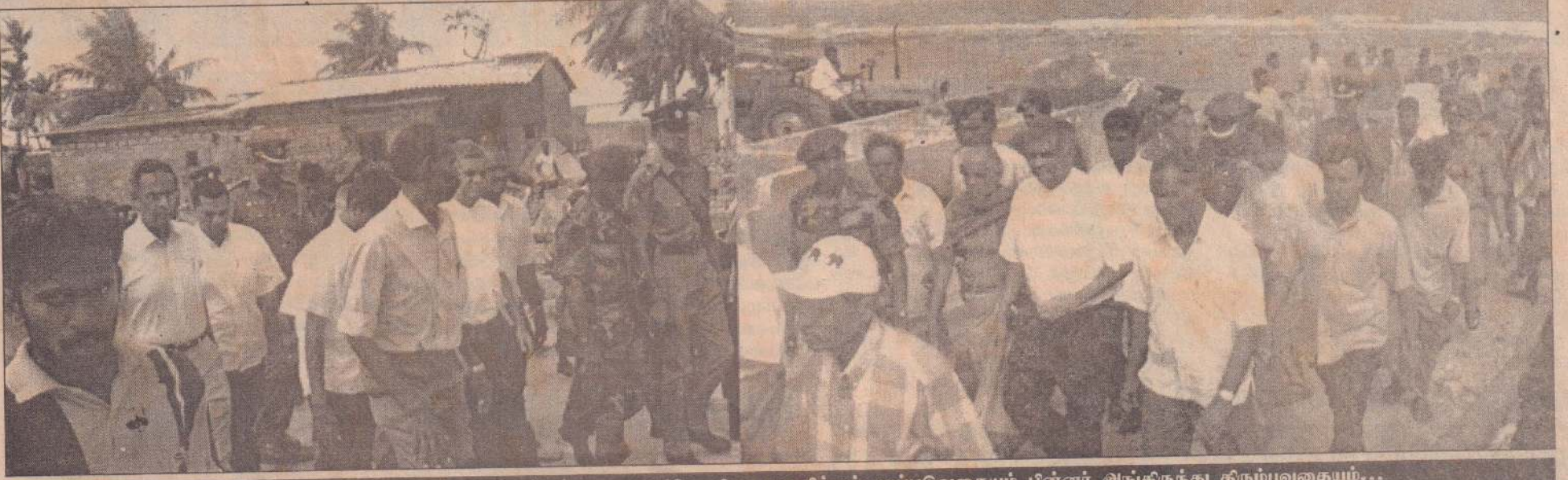
எதிர்க்கட்சித் தலைவர் ரணில் வல்வெட்டித்துறை ஆதீகாவிலடி பகுதிக்குப் புறப்படுவதையும் பின்னர் அங்கிருந்து திரும்புவதையும்...