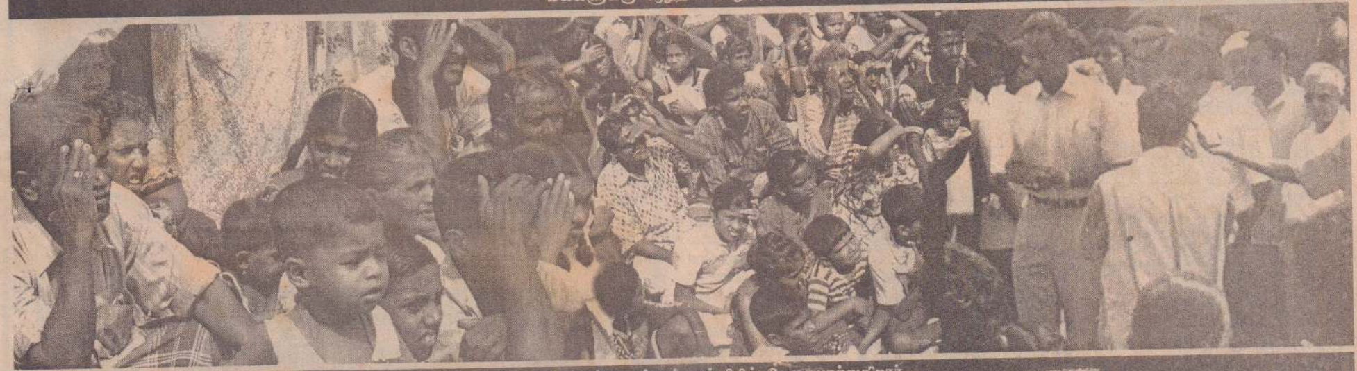
வெயிலில் காத்திருந்த மக்கள் மத்தியில் உரையாற்றுகிறார்...