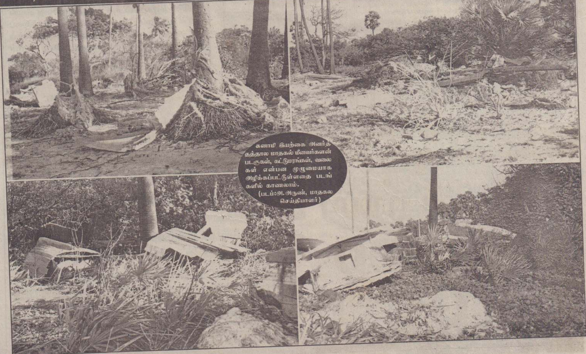
சுனாமி இயற்கை அனர்த்தத்தால் மாதகல் மீனவர்கள் படகுகள், கட்டுரைகள், வலைகள் என்பன முழுமையாக அழிக்கப்பட்டுள்ளதை படங்களில் காணலாம்.