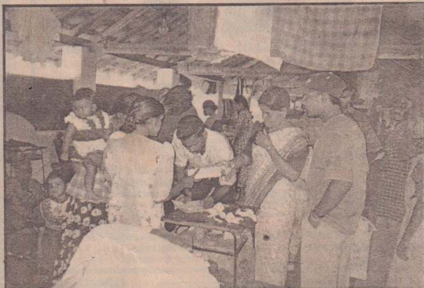
யாழ். நகர் மைய நோட்டரடக் கழகத்தினர் கடந்த திங்கட்கிழமை புலோலியில் உள்ள பாடசாலையொன்றில் தங்கியுள்ள பாதிக்கப்பட்ட மக்களுக்கு சத்துணவு, குழந்தைகளுக்கான பானாட்டல் உபகரணங்கள் ஆகியவற்றை வழங்கிய போது எடுக்கப்பட்ட படம்.

முற்றுப்பரவூதிகளுக்கு தலா 15 ஆயிரம் ரூபா வீதமும், மூன்று உழவு இயந்திரங்களுக்கு தலா 5 ஆயிரம் வீதமும் அபராதம் விதிக்கப்பட்டது. (8-117)