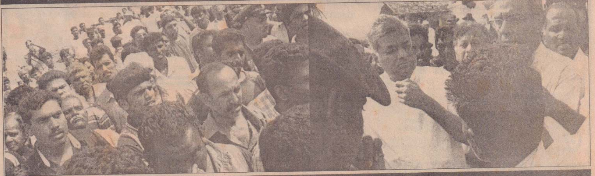
மக்களுக்கு ஆறுதல் கூறுகிறார்...