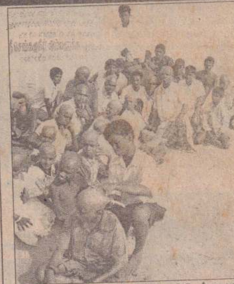
சுனாமி அனர்த்தத்தில் உயிரிழந்த தமது உறவுகளின் ஆத்மங்கள் சாந்தியடைய வேண்டி தமதுகூடத்தில் கரையோரப் பகுதி ஒன்றில் சிறுவர்கள் நேற்று சொடை வழுந்து சமயச்சிறியைகளுக்கு ஆயத்தமாகப்போயு... (16ஆம் பக்கம் பார்க்க)

அந்நேரத் தொடர்ந்து யாழ்ப்பாணம், செயலகத்தில் இடம்பெற்ற திணைக்களத் தலைவர்களுடனான கலந்துரையாடலில் சுனாமி அனர்த்தத்தினால் பாதிக்கப்பட்ட மக்களுக்கு வழங்க (16ஆம் பக்கம் பார்க்க)