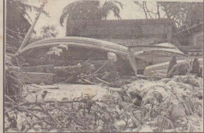
நாகர்கோவிலிருந்து கட்டைக்காடு வரையான கரையோரப் பிரதேசம் விடுதலைப் புலிகளின் கட்டுப்பாட்டிலேயே இருந்து வருகின்றது.

சுனாமி கடற்கொந்தளிப்பைப்படுத்தும் கட்டுப்பாட்டுப் பிரதேசத்தில் வாழ்ந்த பாதிக்கப்பட்ட பொதுமக்களுக்கு மட்டுமன்றி, அரசின் கட்டுப்பாட்டுப் பிரதேசத்தில் வசிக்கும் பாதிக்கப்பட்ட தமிழ் மக்களுக்கும் நிவாரணப் பணிகளை விடுதலைப் புலிகள் முன்னின்று சிறப்பான முறையில் மேற்கொள்வதை அப்பகுதிகளைப் பார்வையிடச் சென்ற எம்மால் அவதானிக்க முடிந்தது. அவர்களது பணி குறித்து பாதிக்கப்பட்ட சகல பொதுமக்களும் திருப்தியடைந்தவர்களாகக் காணப்பட்டமையையும் நாம் அவதானித்தோம்.