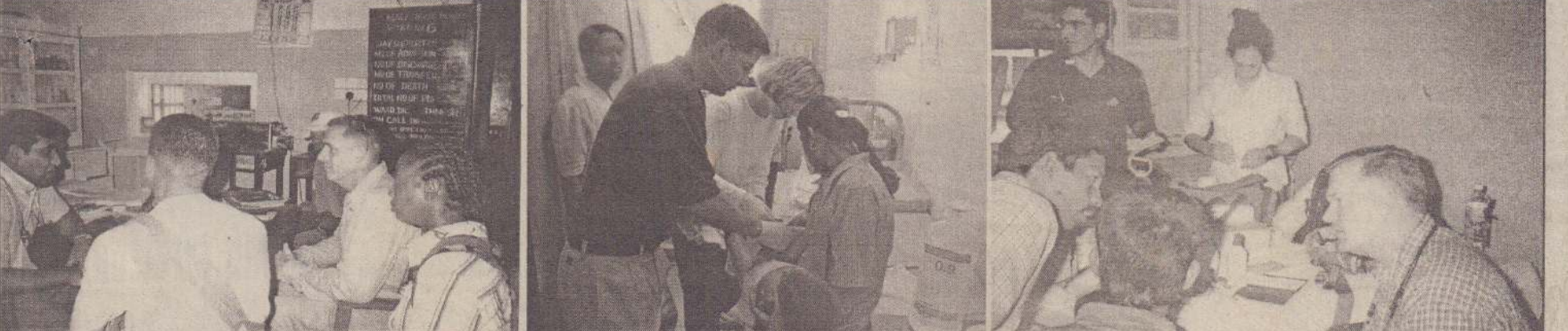
நேற்று மந்திகை வைத்தியசாலையில் மருத்துவ நடவடிக்கையில் ஈடுபட்ட அமெரிக்கக் கடற்படையைச் சேர்ந்த வைத்தியர்களைப் படத்தில் காணலாம்.

இவ்வீதியின் திருத்த வேலைகளுக்கென வதிகளில் குறுக்காக கிரவல் பறிக்கப்பட்டுள்ள போதிலும் திருத்த வேலைகள் நடைபெறாமையால் மேலும் சிரமங்களை எதிர்கொள்வதாகவும் கவலை தெரிவிக்கப்பட்டது. (த-323-202)