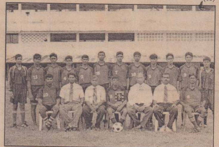
வல்கோம் கல்வி வலயத்தால் நடத்தப்பட்ட 18 வயதுப் பிரிவுப் பாடசாலை அணிகளுக்கிடையிலான உதைபந்தாட்டச் சுற்றுப் போட்டியில் சம்பியனான மானியாய் கிந்துக் கல்லூரி அணியினரைப் படத்தில் காணலாம். (10)

யாழ்ப்பாணம், ஜன.21 யாட்டுக் கழக அணி ஆகியன கலந்துகொள்ளவுள்ளன. நாளை சனிக்கிழமை காலை 8.30 மணிக்கு நடைபெறவுள்ள முதல் போட்டியில் யாழ். பல்கலைக்கழக அணியும் ஜொலிஸ்ரார்ஸ் அணியும் போதுகின்றன. பிற்பகல் ஒரு மணிக்கு நடைபெறவுள்ள இரண்டாவது போட்டியில் கொக்குவில் மத்திய சனசமூக நிலைய அணியும் யாழ். பற்றிசியன் அணியும் போதுகின்றன. இப்போட்டியின் இறுதியாட்டம் எதிவரும் 30ஆம் திகதி ஞாயிற்றுக்கிழமை காலை 8.30 மணிக்கு இடம்பெறும். (10)