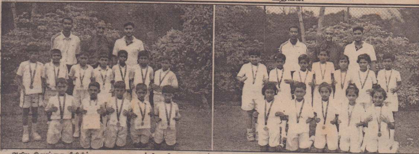
அகில இலங்கை ரீதியில் பாடசாலைகளுக்கிடையே நடைபெற்ற 8 வயதுக்குட்பட்டோருக்கான மனிதன் போட்டியில் யாழ். மாவட்ட ஆண்கள் அணி கிரண்டாவது தடவையாகச் சம்பியனாகியுள்ளது.

கிறுதியாட்டத்தில் குருநாகல் மாலிக் தேவா பாடசாலை அணியை 4-3 என்ற புள்ளி வித்தியாசத்தில் வெற்றிபெற்று யாழ். மாவட்ட அணி சம்பியனாகியது.