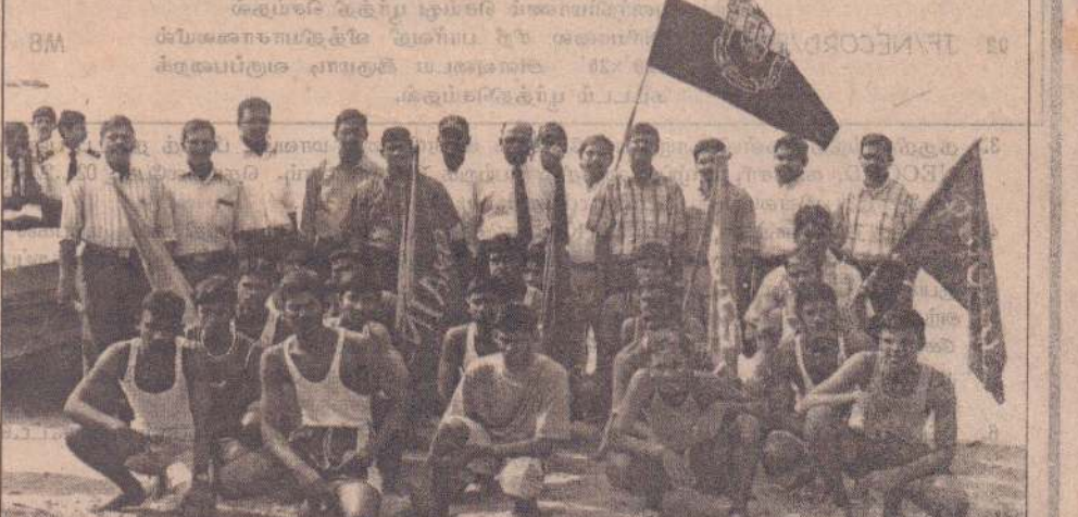
யாழ்.மத்திய கல்லூரி மெய்வன்மைப் போட்டியை முன்னிட்டு கில்லங்களுக்கு கிடையே நடைபெற்ற படகோட்டப் போட்டியில் கலந்துகொண்ட கில்ல வீரர்களையும் பொறுப்பாசிரியர்களும், அதிபர் ஆகியோரையும் படத்தில் காணலாம்.

மையும் நடைபெறவுள்ள ஆட்டங்களில் பங்குபற்றவுள்ள அணிகளின் விவரம் வருமாறு: ★ கொக்குவில் இந்துக் கல்லூரி மைதானத்தில் இடம்பெறவுள்ள ஆட்டத்தில் யாழ். மத்திய கல்லூரி அணியை எதிர்த்து கொக்குவில் இந்துக் கல்லூரி அணியும் -