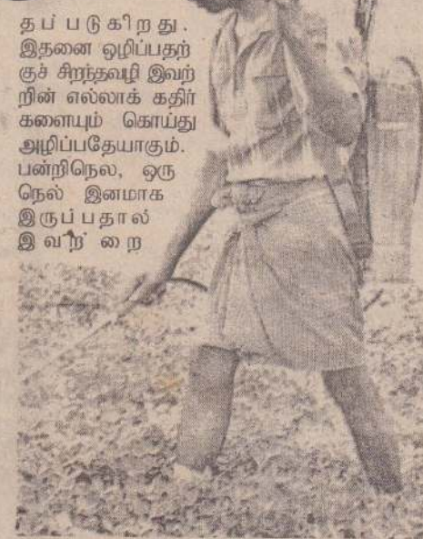
தப்புகிறது. இதனை ஒழிப்பதற்கு சிறந்தவழி இவற்றின் எல்லாக் கதிர்களைப் கொய்து அழிப்பதேயாகும். பன்றிநெல், ஒரு நெல் இனமாக இருப்பதால் இவற்றை

செல்லக்கூடாது. நடந்துசென்றால் அந்த இடத்து மருந்து விணாகிவிடும். அந்த இடங்களில் புல் முளைக்கச் சந்தர்ப்பம் உண்டு. தெருவில் தார் ஊற்றுவது போல வயலின் பக்கம் பக்கமாக நின்று தெளிகருவிகளால் மருந்தை விசிறும் போது நாம் அதன் மீது நடக்காமலும் மருந்து சீராகிவிடும். ஏனைய பயிர்களுக்கு கிருமிநாசினி விசிறுவது போல் இதற்கும் அழுக்காக அடிக்கத் தேவையில்லை. அநேகமான விவசாயிகள் புல்லுக்கு மருந்து அடிக்கும்போது இந்த நொசில்களைப் பூட்டிப் பயன்படுத்துவதில்லை. இந்த நொசில்களை 'டொலிஜென்' (உடைப்பு பீச்சு முனை) என்று கூறுவார்கள். இந்த நொசில்களைப் பற்றித் தெரிந்திருந்தும் கூட அதனை எதற்காகப் பயன்படுத்துவது என்பது தெரியாமையால் தான் விவசாயிகள் அதனை உபயோகிப்பதில்லை. 'துலாபம்' எனக் கூறப்படும் 'ஹெலிஸ் பம்' வாங்கும்போது இந்த நொசில்களும் வழங்கப்படுகின்றன. எவ்வளவோ பணம் செலவழித்து புல் மருந்து அடித்தாலும் இந்த நொசில்களை உப