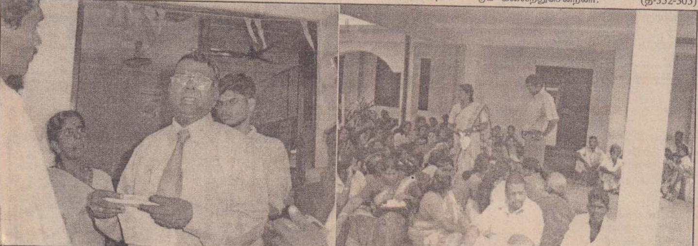
அரசு கொடுப்பனவுகள் வழங்கப்படாததற்கு ஆட்சேபம் தெரிவித்து மறியல் போராட்டத்தில் ஈடுபட்ட மக்கள் கிளிநொச்சி மாவட்ட அரசு அதிபர் தி.இராச நாயகத்திடம் மகஜர் கையளிப்பதை முதலாவது படத்திலும் - போராட்டத்தில் ஈடுபட்ட ஒரு பகுதி மக்களை இரண்டாவது படத்திலும் காணலாம்.

கிளிநொச்சி, பெப். 10 சனாதிபரேழிவை அடுத்து இடம்பெயர்ந்து முகாம்களில் தங்கியுள்ள மேலும் 96 குடும்பங் களுக்கு தமிழர் புனர்வாழ்வுக்கழகம் தற்காலிக வீடுகளை அமைத்துக் கொடுத்துள்ளது. உடையாங்கட்டு மகா வித்தியாலயம், புதுக் குடியிருப்பு கோகவித்தியாலயம், இரண்டாலை மகாவித்தியாலயம், புதுக்குடியிருப்பு மகாவித்தி யாலயம், கைவேலி மகா வித்தியாலயம் என் பவற்றில் தங்கியிருந்த குடும்பங்களுக்கு பொக் கணை, வலைஞர்மடம், பணையடி ஆகிய இங் களில் தற்காலிக வீடுகள் அமைத்துக் கொடுக் கப்பட்டுள்ளன. மீள்குடியமர்ந்த மக்களுக்கு சமையல் உப கரணங்கள், உணவுப் பொருள்கள், தலா ஆயி ரம் ரூபா என்பனவும் இவ்வாறு வழங்கப்பட் டன. (எ-202)